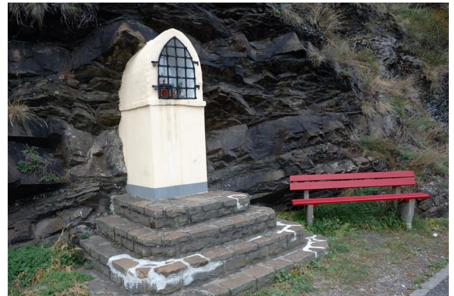
Einkehrmöglichkeit direkt neben der Straße