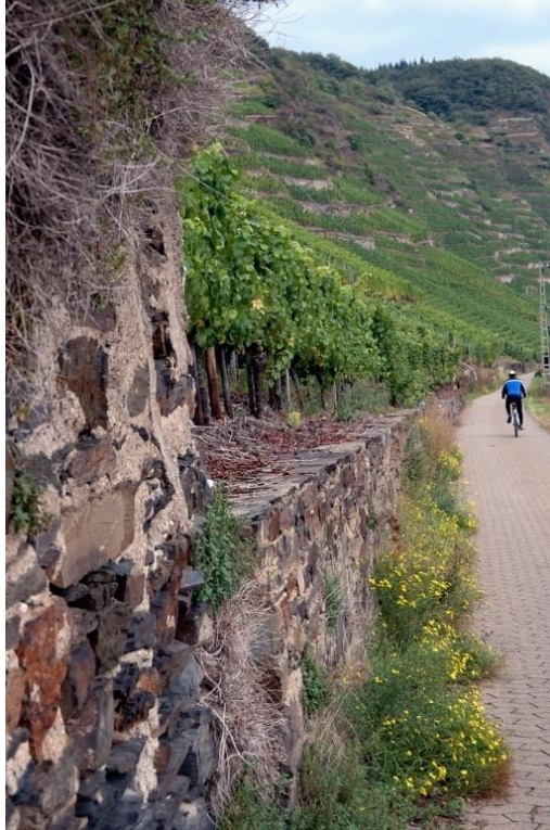
Den unteren Weg teilen sich Radfahrer und Wanderer