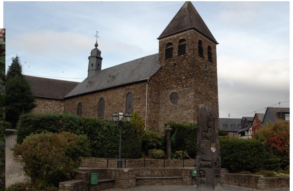
Dorfkirche in Moselsürsch