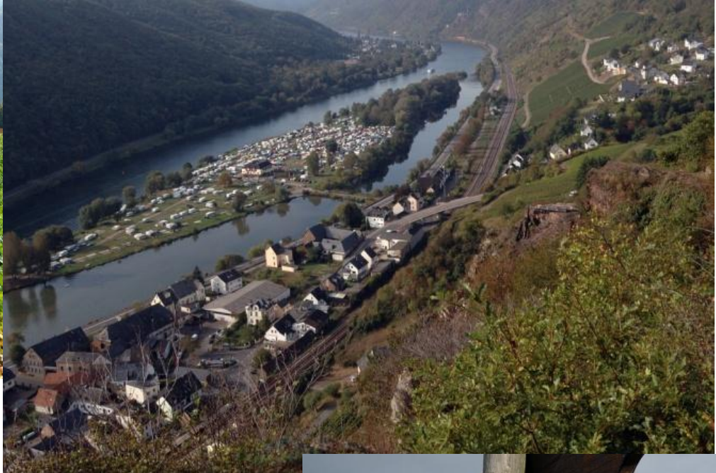
Blick auf Hatzenport