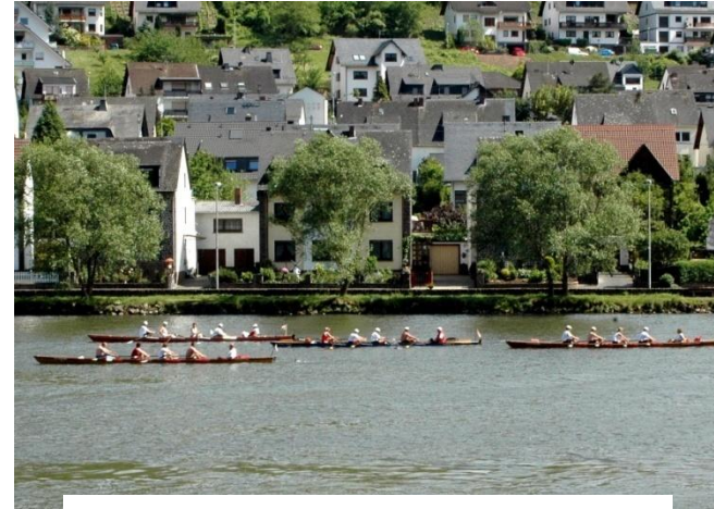
Bootsregatta auf der Mosel