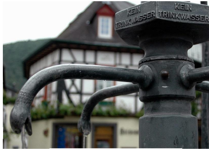
Brunnen in Winningen