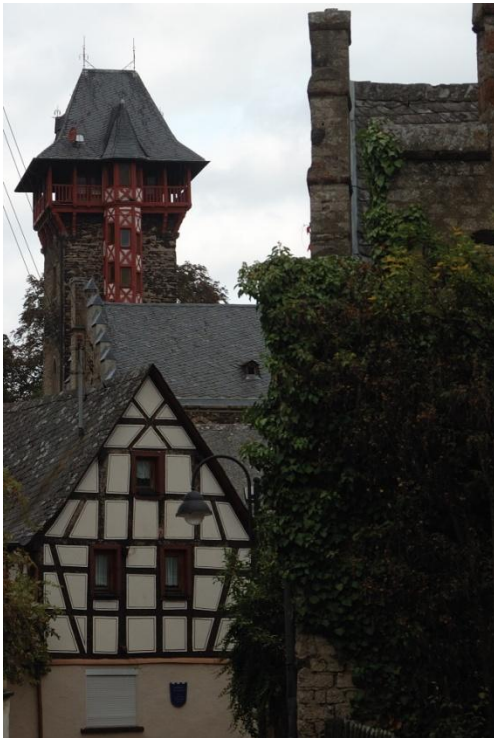
Turm der Niederburg in Koblenz-Gondorf