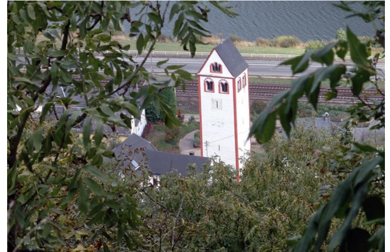
Kirchturm in Lehmen