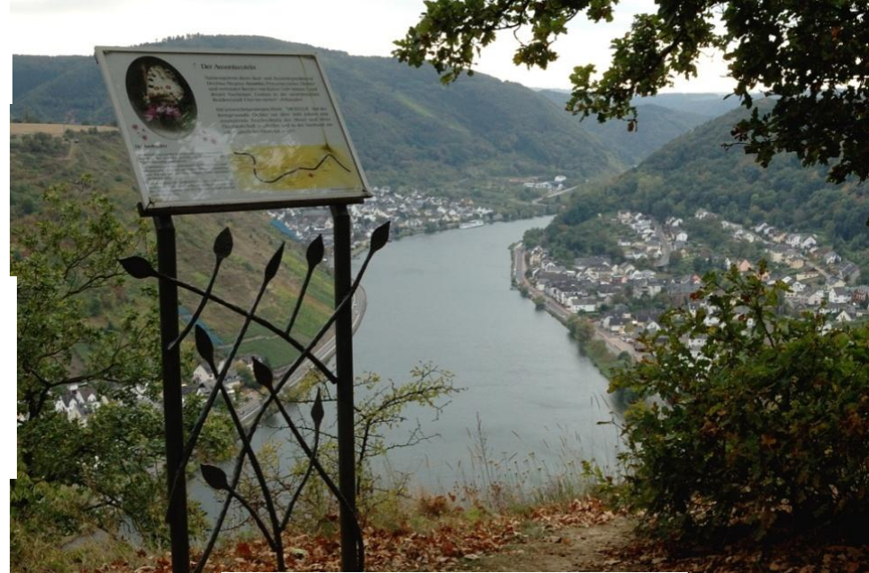
Vom Aussichtspunkt Ausoniusstein hat man einen schönen Blick auf die Mosel