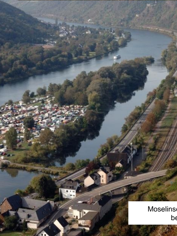
Moselinsel mit Campingplatz bei Hatzenport