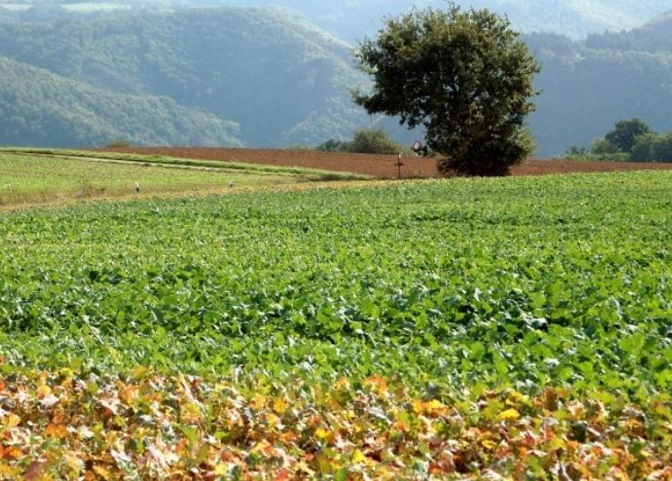
Auf den Moselhöhen ist das Anbringen und Finden von Markierungen nicht immer einfach