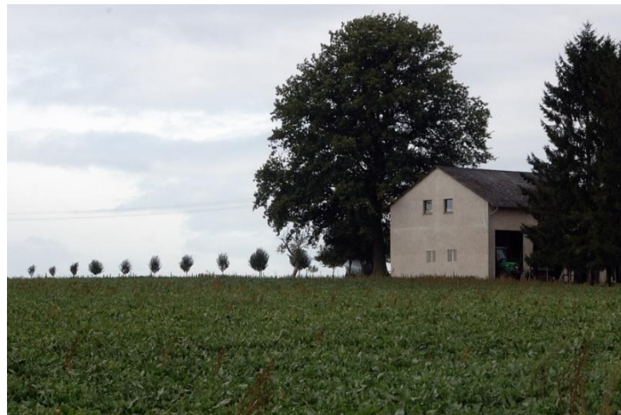
Der Kergeshof oberhalb von Löf