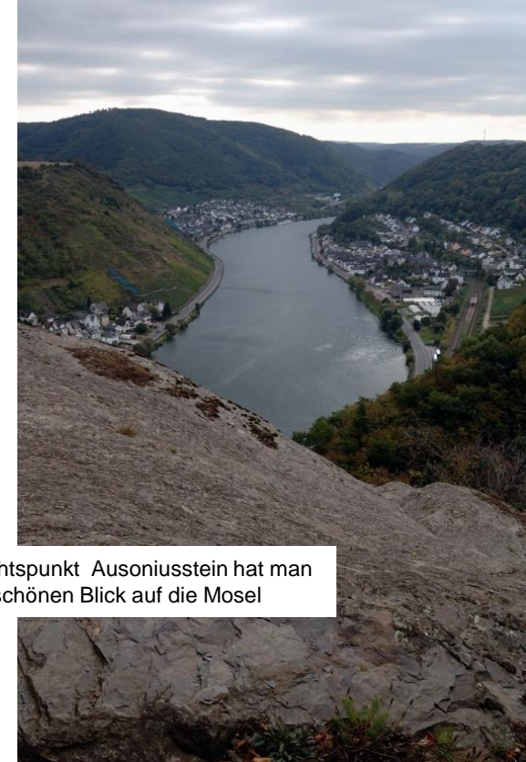
Vom Aussichtspunkt Ausoniusstein hat man einen schönen Blick auf die Mosel