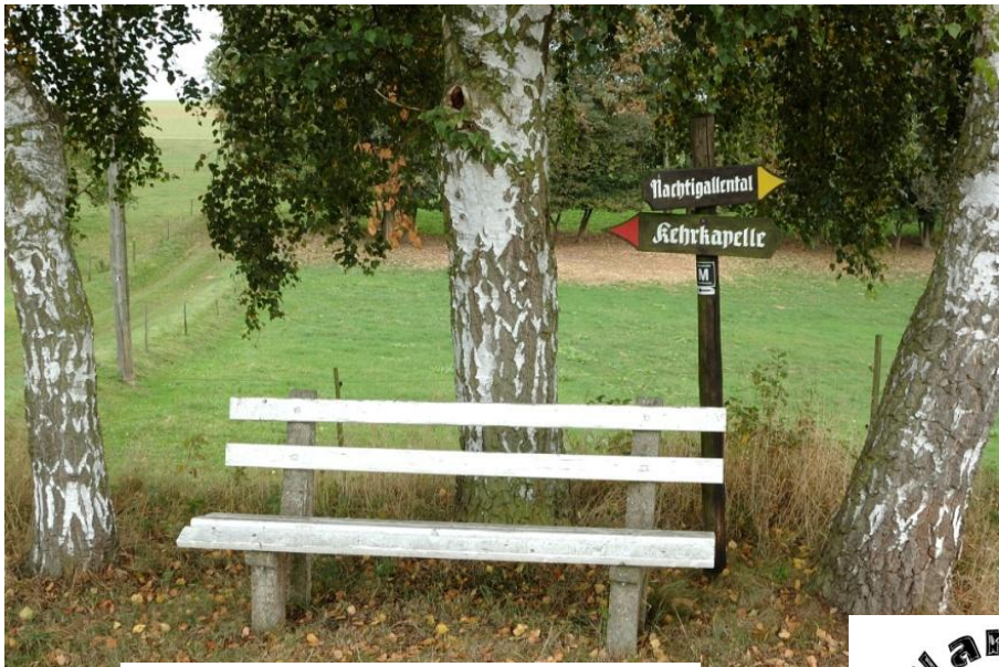
Zwischen Birken entspannt verweilen