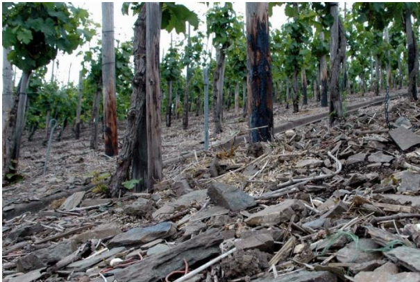
Typisch für den Weinbau an der Mosel Schieferboden