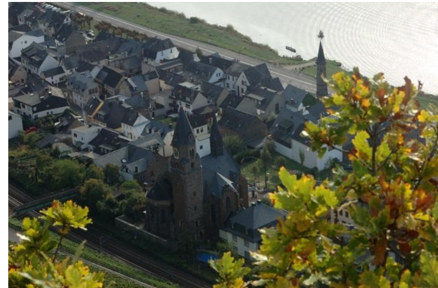
Blick auf den Ortskern von Hatzenport