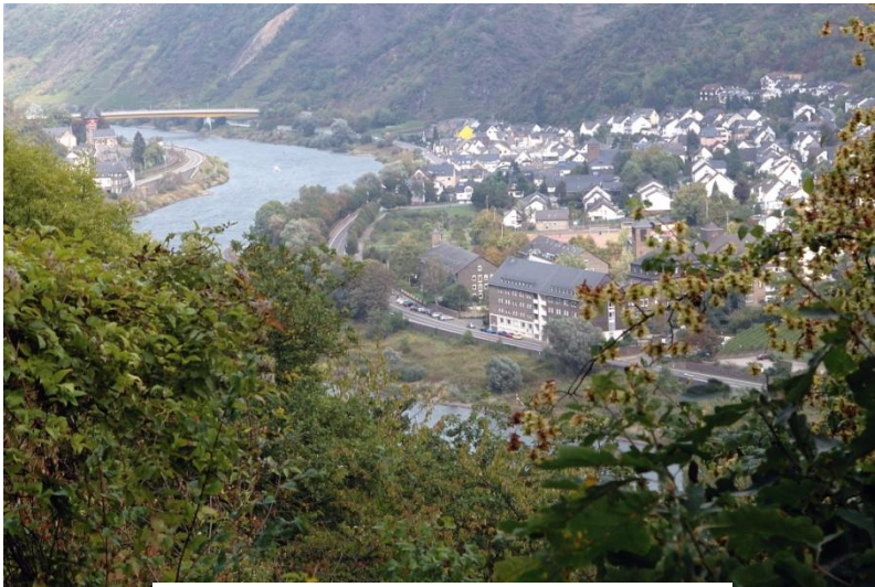
Mosel zwischen Koblenz-Gondorf und Niederfell