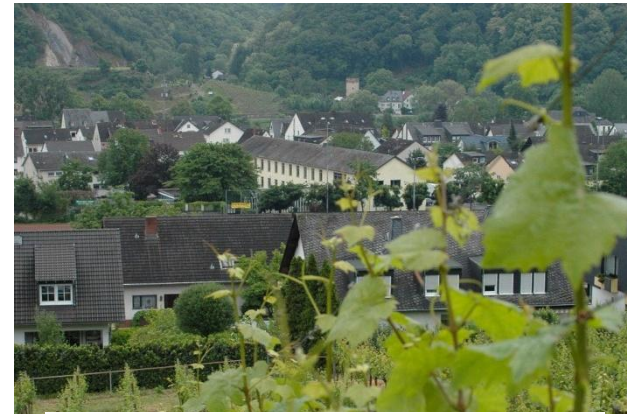
Blick auf Winningen