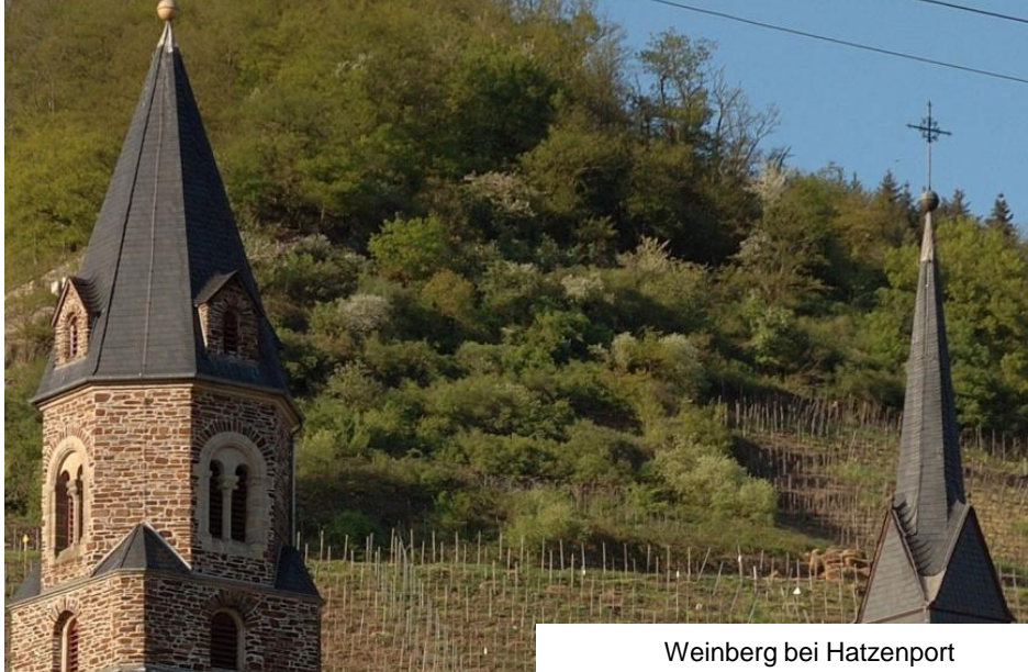
Weinberg bei Hatzenport