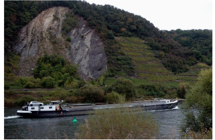
Mosel bei Koblenz-Gondorf