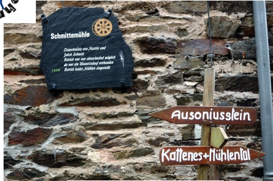
Am Weg liegt die Schmittmühle