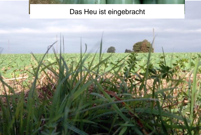
Blick über die Moselhöhen im Herbst