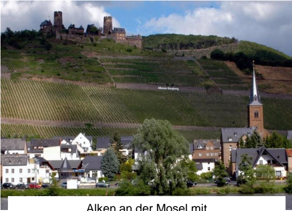
Alken an der Mosel mit