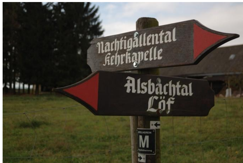
Auf den Moselhöhen trifft der Moselhöhenweg auf einen Traumpfad