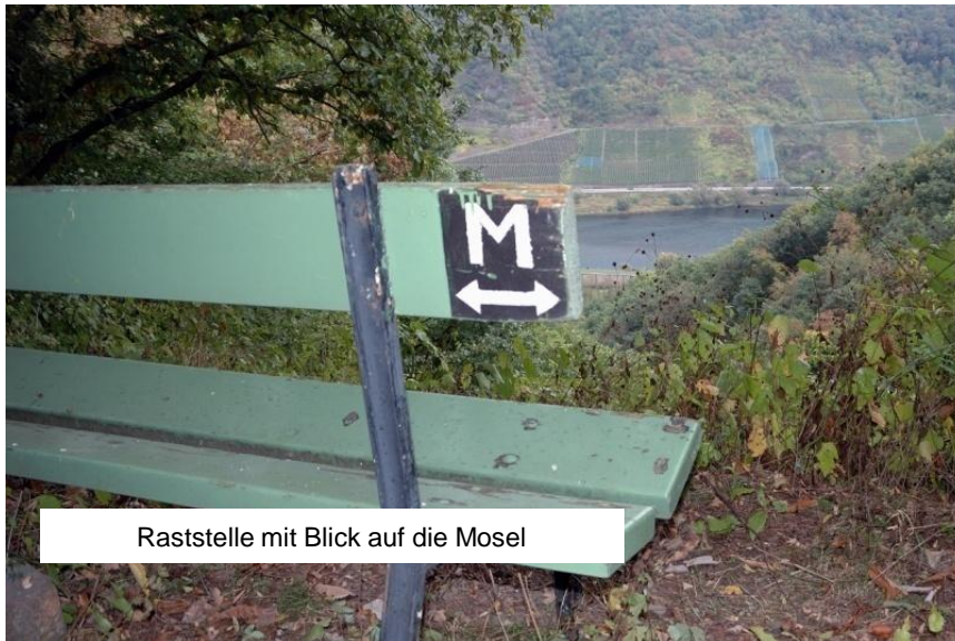
Raststelle mit Blick auf die Mosel