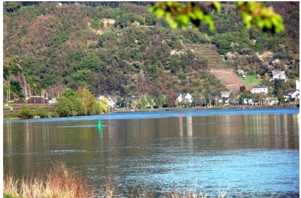
Moseltal von Hatzenport aus gesehen