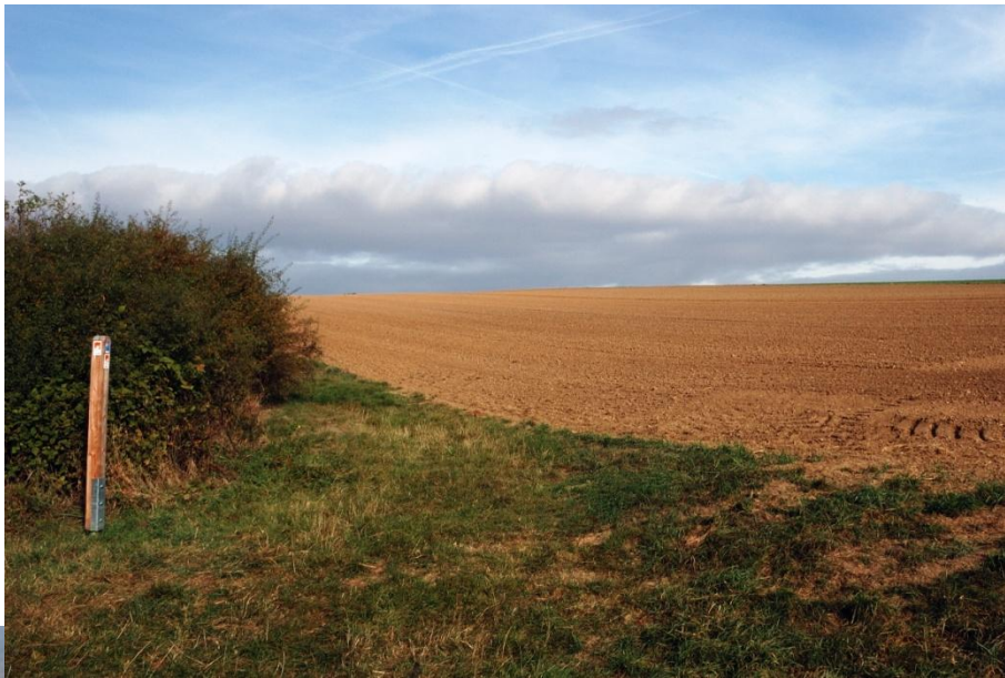
Blick über die Moselhöhen im Herbst