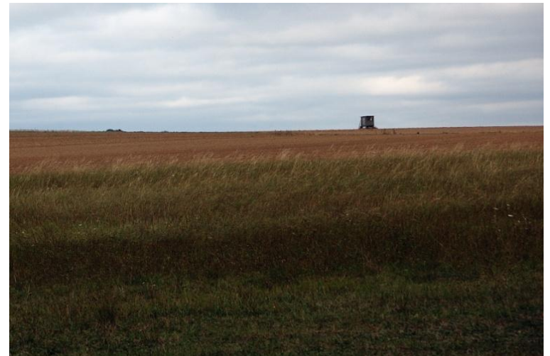
Moselhöhen im Herbst