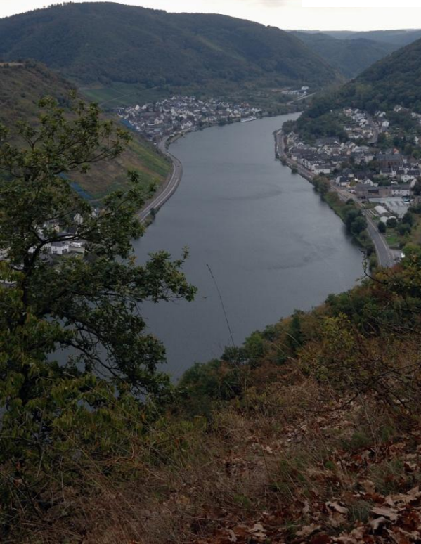
Mosel mit links Alken und rechts Kattenes