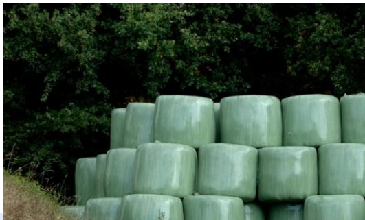
Das Heu ist eingebracht