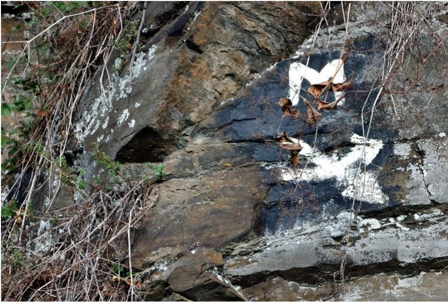
Wir folgen der Markierung: Weißes M