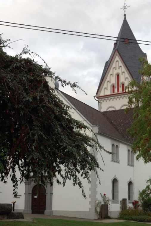
Kirche in Winningen