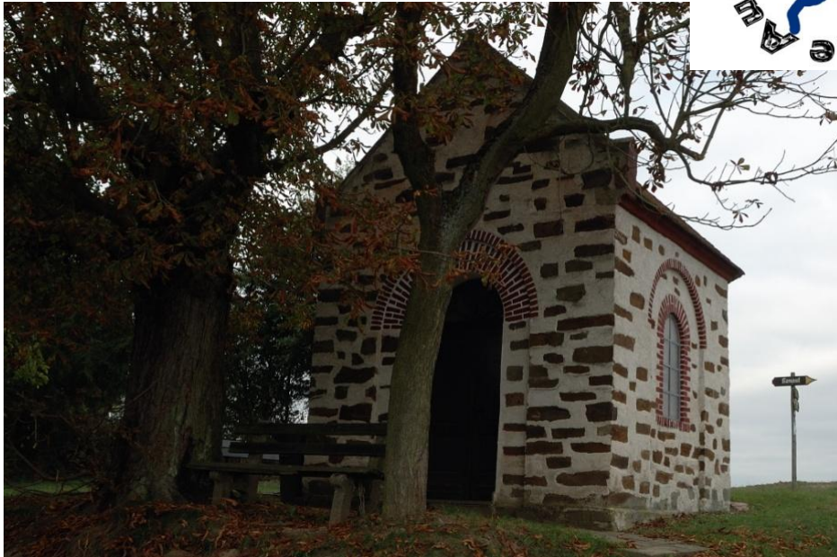
Die Kehrkapelle ist Zielpunkt von mehren Wegen