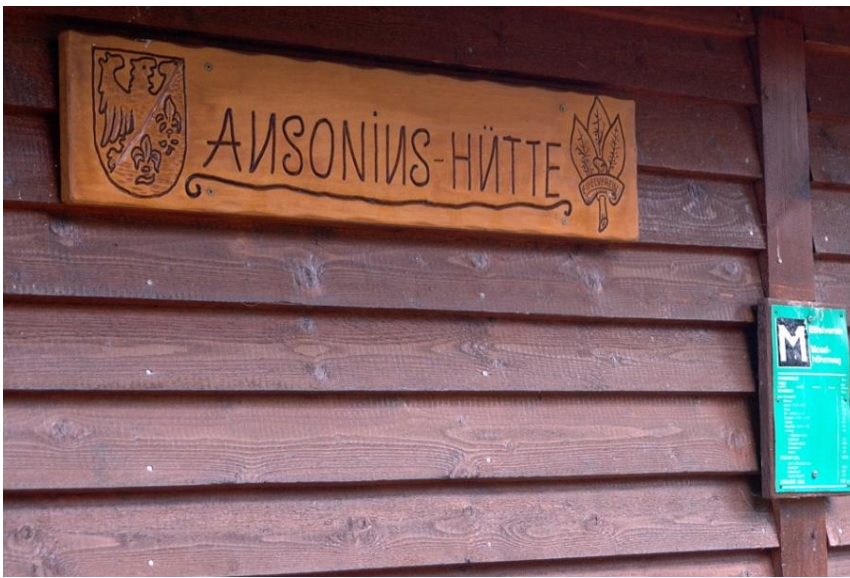
Eine komfortable Hütte am Weg ist die Ausonius-Hütte