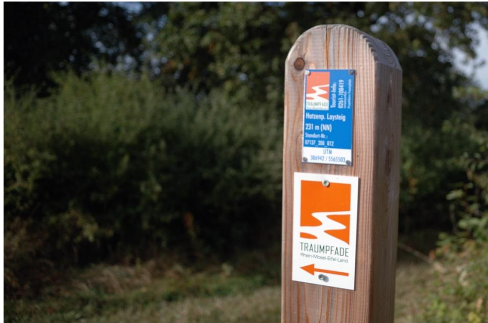
Auf den Moselhöhen trifft der Moselhöhenweg auf einen Traumpfad