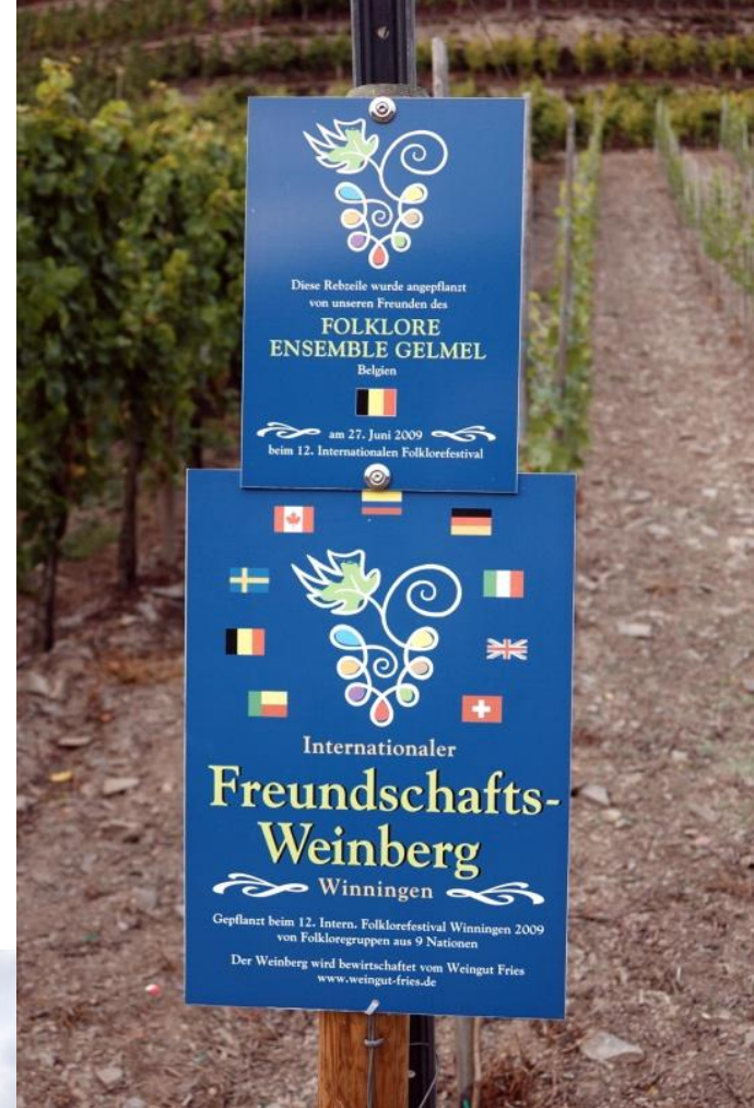
Wein kann verbinden