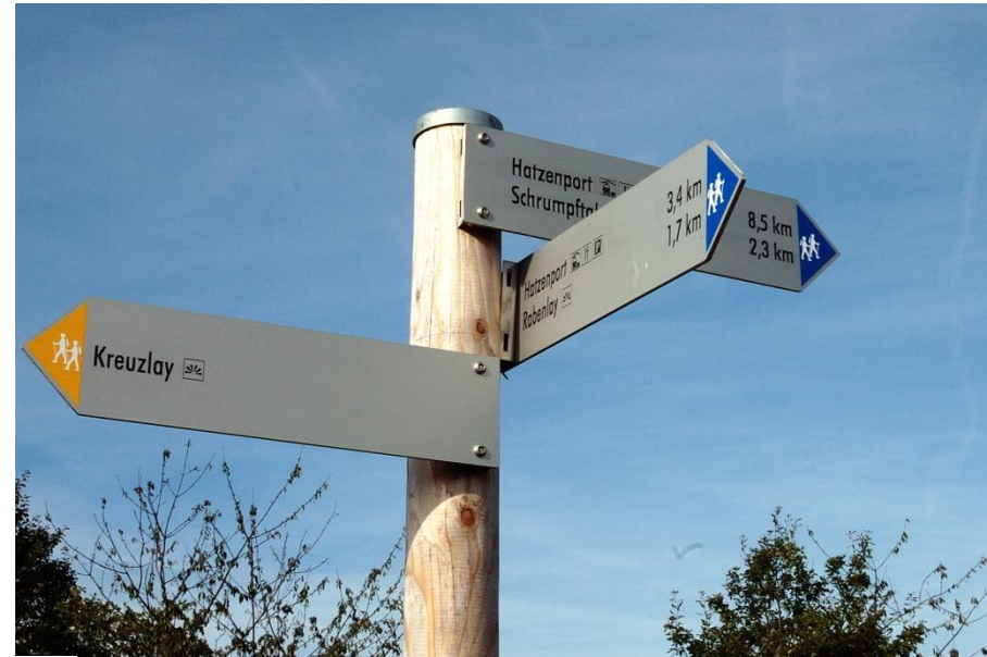
In der Nähe von Traumpfadend Markierung hervorragend