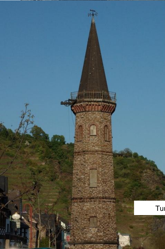
Turm in Hatzenport