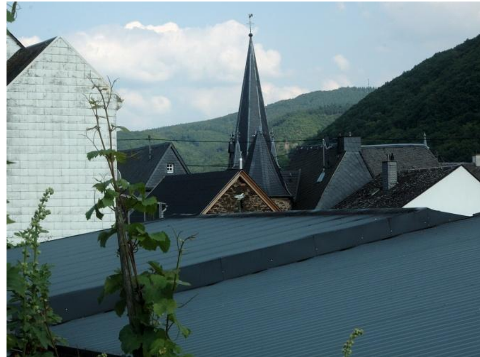
Blick über die Dächer n von Pommern