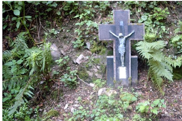
Gelegenheit zur Besinnung...