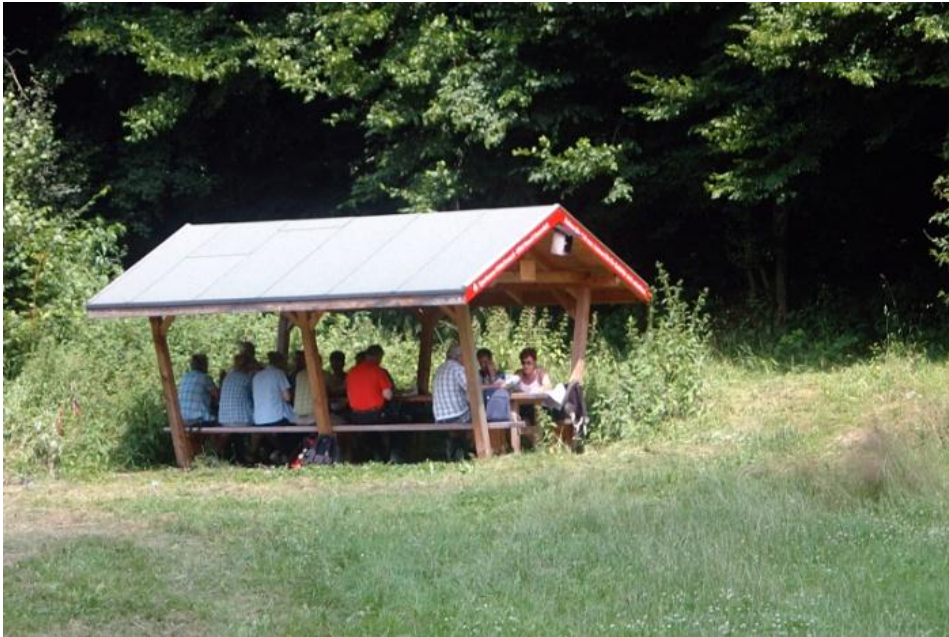
In der Nähe der Klosterruine Rosenthal steht dieses Rasthäuschen