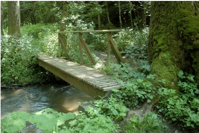
Nun wechselt der Weg zwischen kleinen Brücken ...