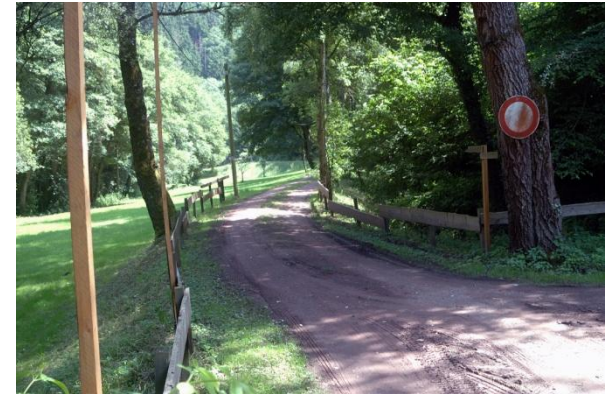
Zufahrt zur Pommermühle