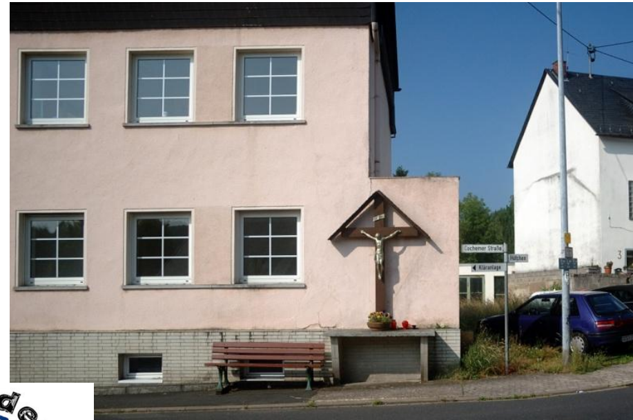
An Kreuz geht es links