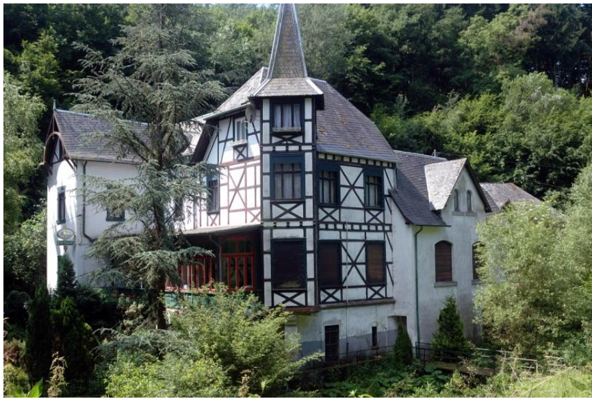
Gasthaus Villa Margareth