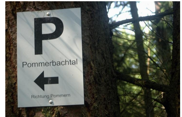
Wegmarkierung ist das schwarze P