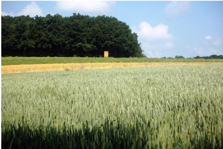
Kurz geht es auch einmal an Feldern vorbei