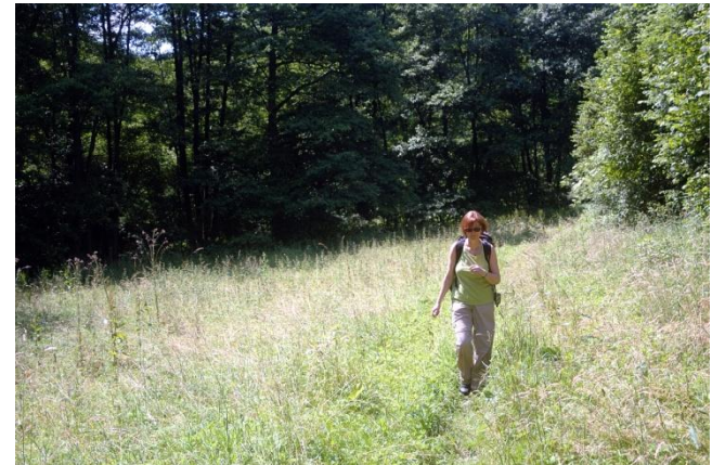
... und kleinen Lichtungen