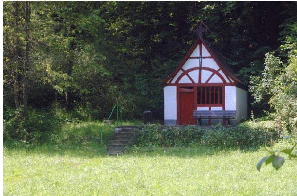
Kapelle und Rastplatz am Wegrand