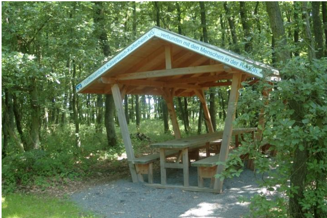
Das Erste von drei Rasthäuschen