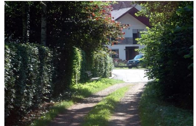
Übergang in den Ort Pommern