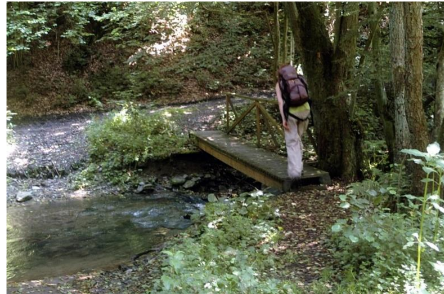
Aber schon bald geht es wieder entlang des Baches