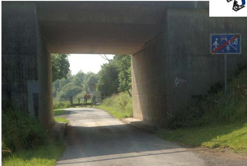
Kurz danach unterquert man die Autobahn