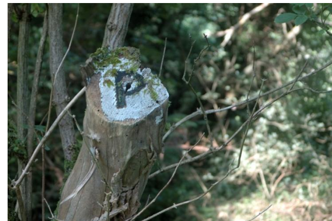
Die Markierung ist durchgängig gut