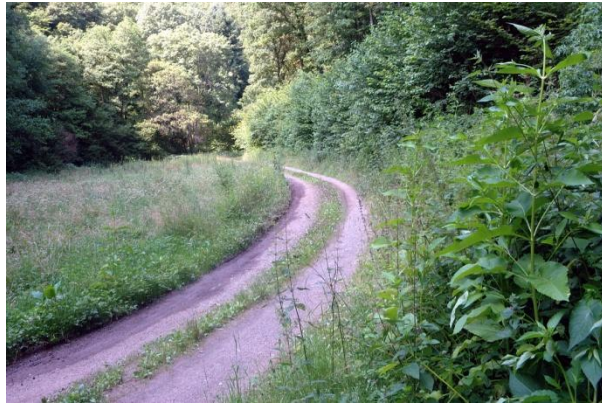
Im letzten Teil führt der Weg über Forstwege