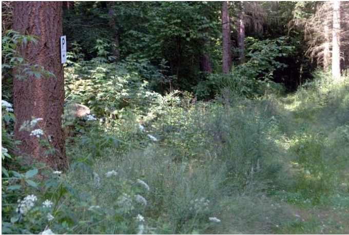
Von nun an geht es auf schmalen Pfaden weiter