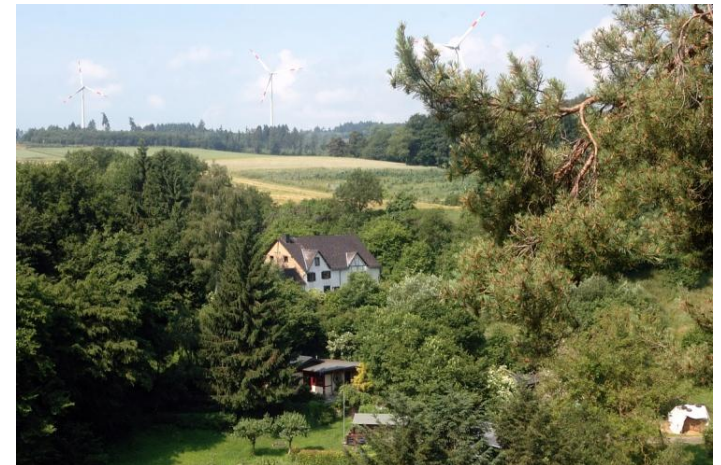
Blick über die Moselhöhen