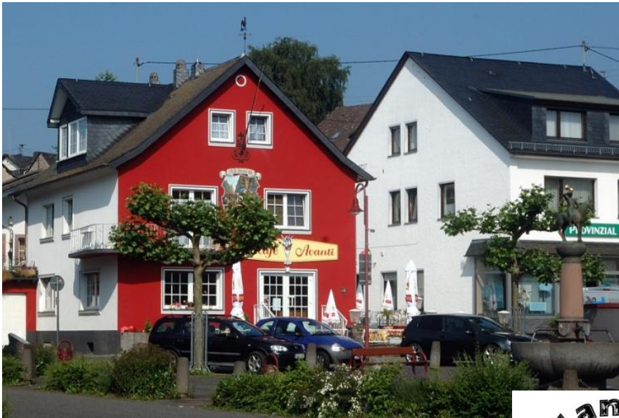
Von der Bushaltestelle geht es zunächst auf das rote Haus zu und da links