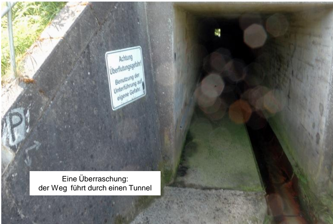
Eine Überraschung: der Weg führt durch einen Tunnel