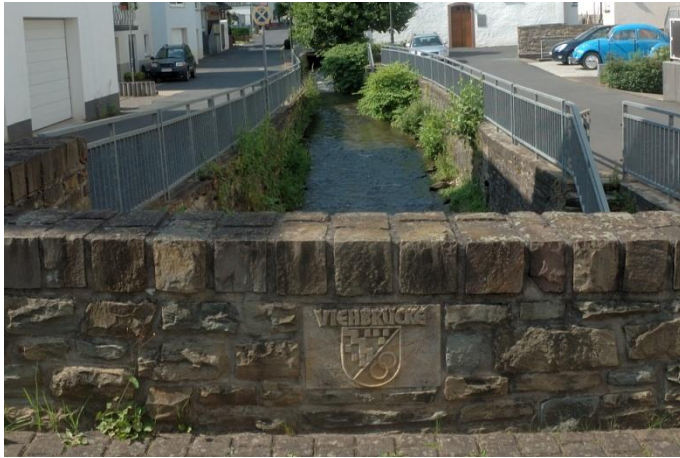
Viehbrücke über den Pommernbach