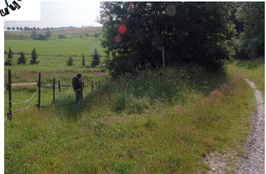
Nach der Kläranlage zweigt der eigentliche Weg links ab