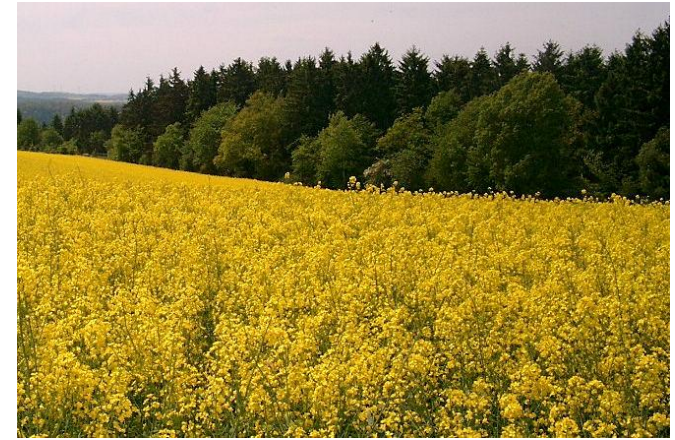
Rapsfelder am Einstieg zum Baybachtal