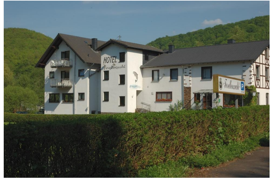
Forellenhof, die letzte Rastmöglichkeit vor Burgen