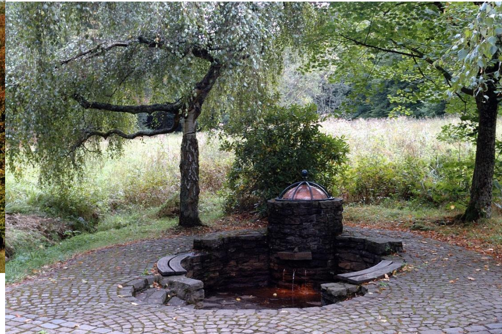
Sauerbrunnen zum Beginn der Tour gelegen