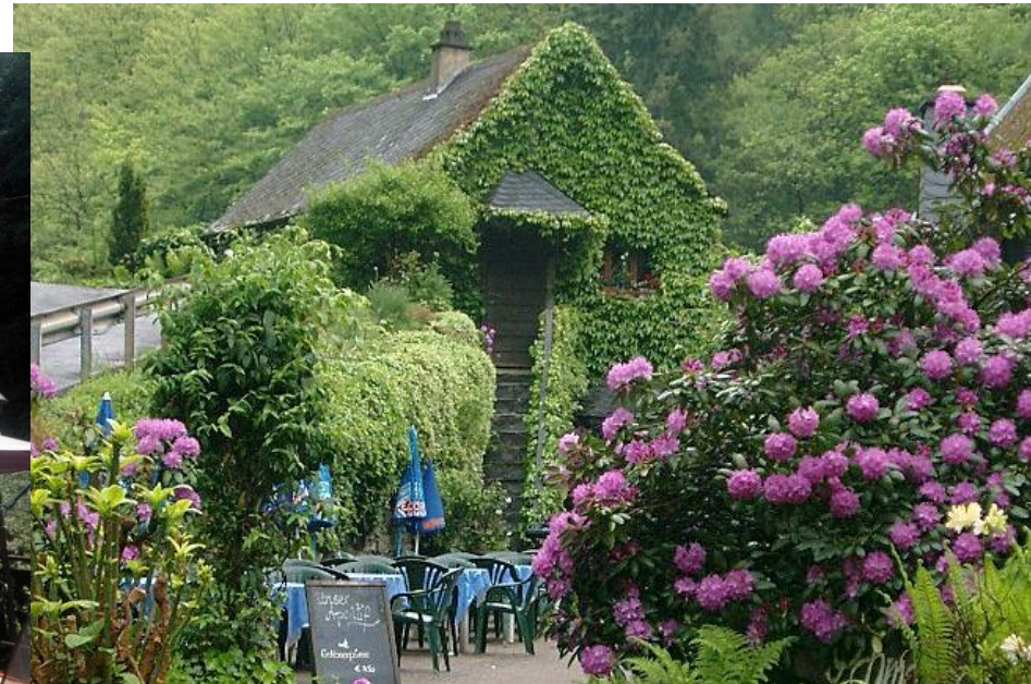
Malerisches Nebengebäude der Schmausemühle