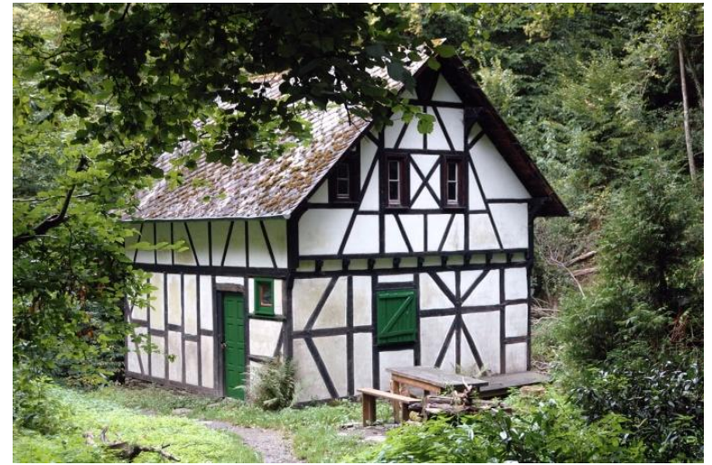
Viele alte Mühlen werden nur noch am Wochenende genutzt.