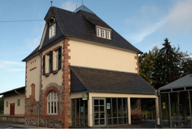
Am Bahnhof in Emmelshausen beginnt unsere Tour