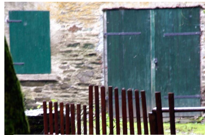
Viele alte Mühlen werden nur noch am Wochenende genutzt.