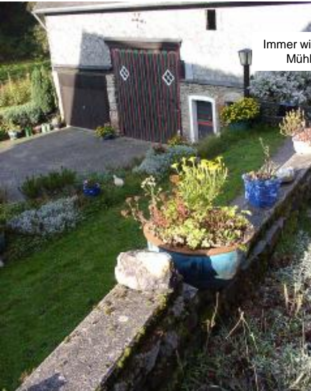
Immer wieder führt der Weg an alten Mühlen und Gehöften vorbei