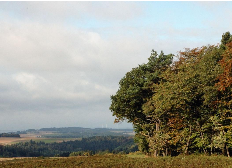
Blick über den Hunsrück