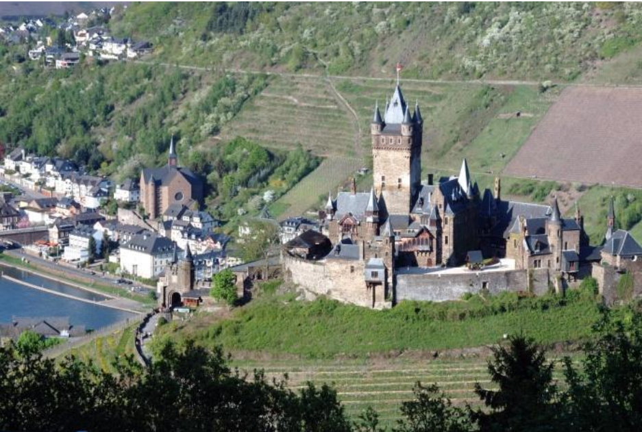
Reichsburg in Cochem