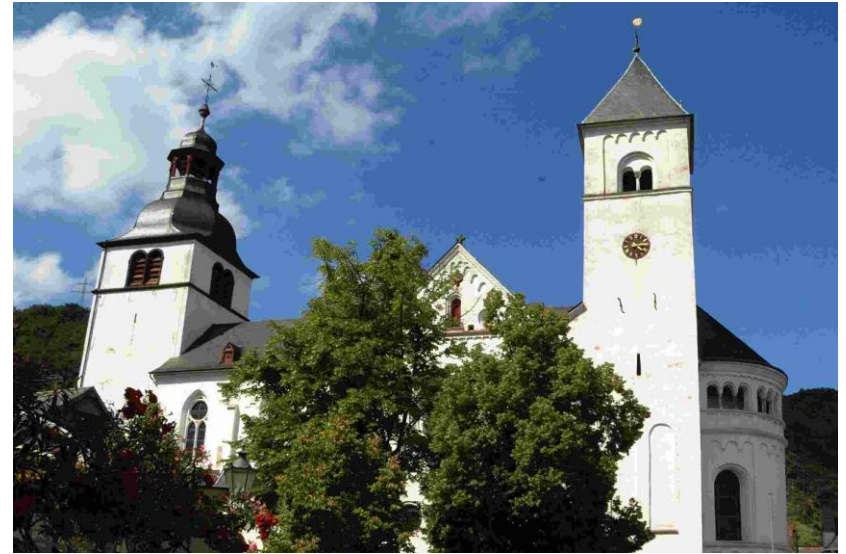
Stiftskirche St. Castor