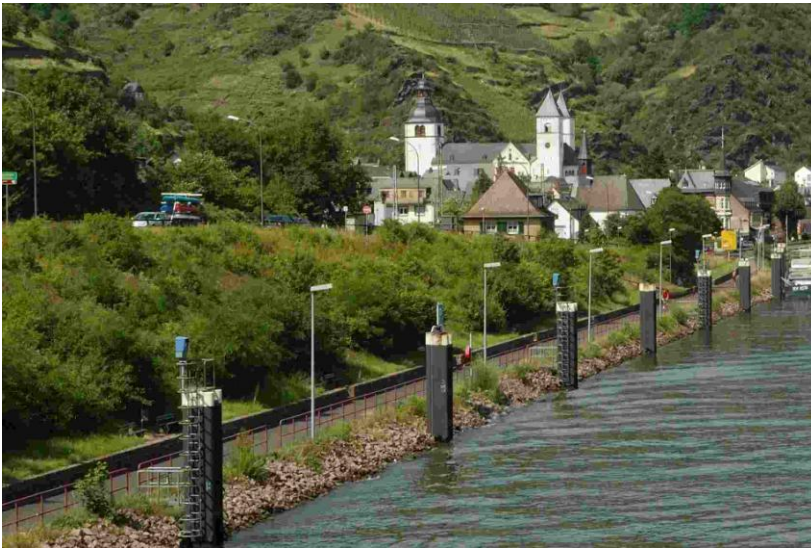
Blick auf Karden