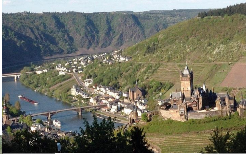
Moseltal bei Cochem – im Vordergrund die Reichsburg