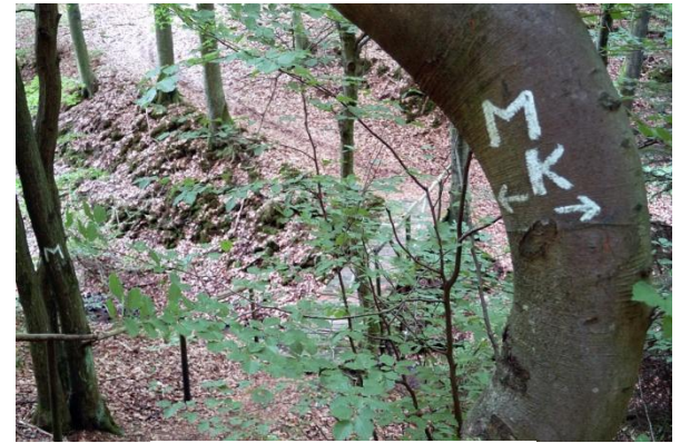
Unser heutiges Wegzeichen