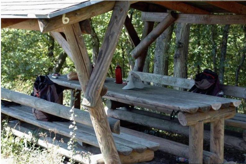
Raststelle Eisener Mast