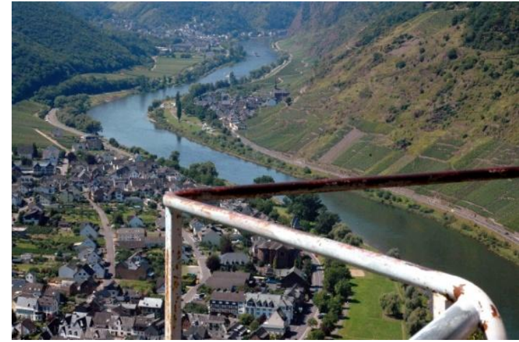
Blick auf Ernst