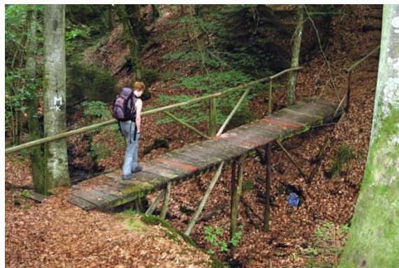
Teils auf schmalen Pfaden