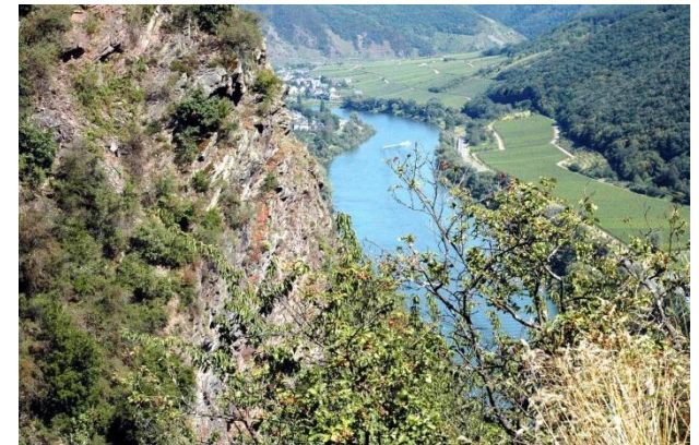
Auch an der Mosel geht es manchmal steil bergab