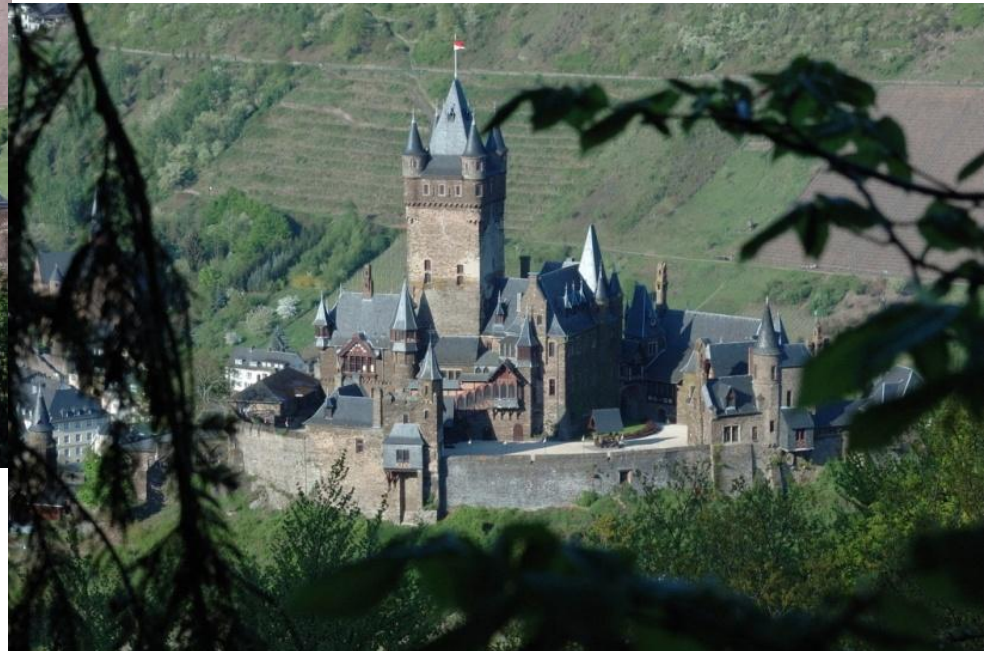
Reichsburg in Cochem