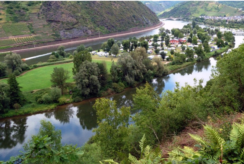
Blick zurück auf Treis