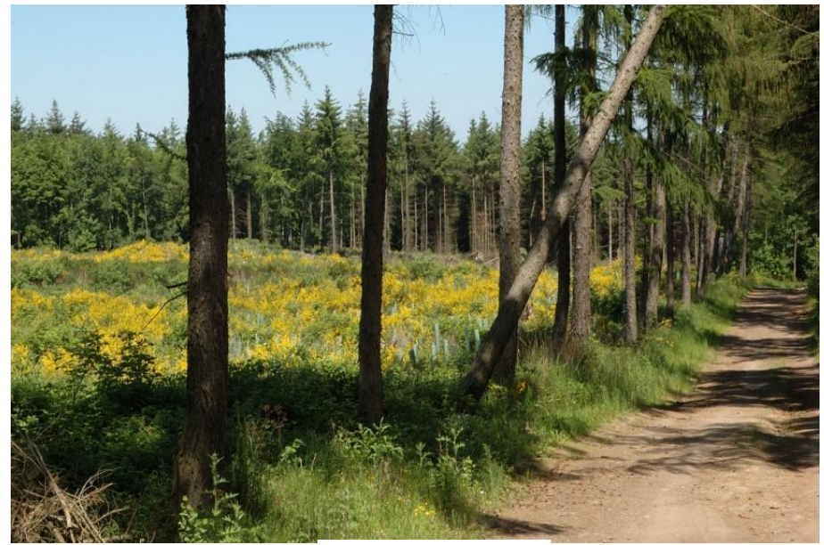
Ginster am Wegrand