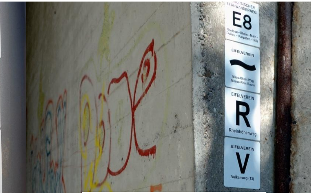
Bis zum Laacher See folgen wir der Markierung „V“