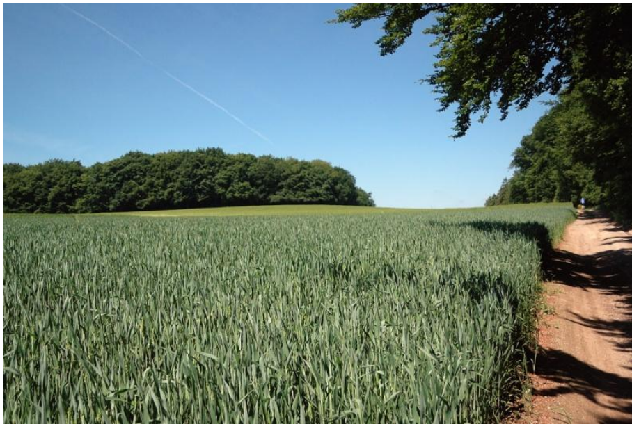
Der Weg führt am Waldrand entlang