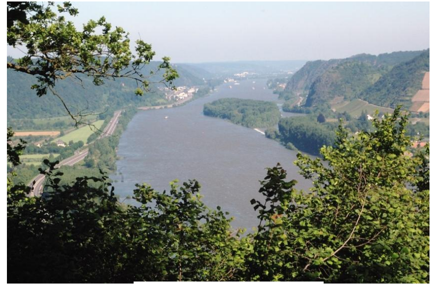
Blick auf den Rhein bei Namedy