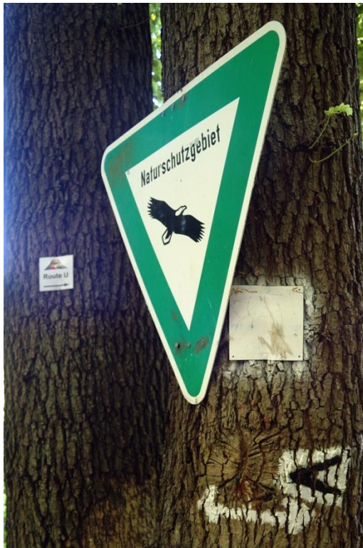
Der Weg führt durch Naturschutzgebiet