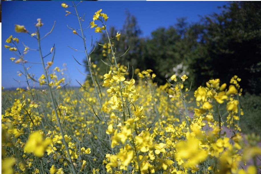
Rapsfeld am Weg