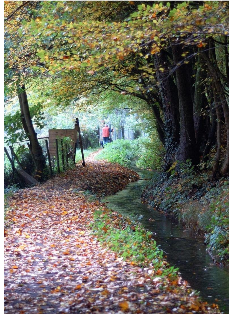
Entlang an alten Bewässerungsgräben geht es auf Brohl zu.