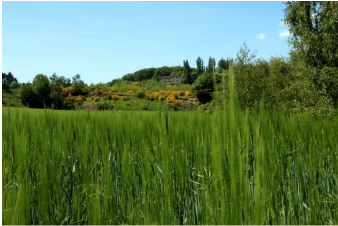
Getreidefeld im Frühling