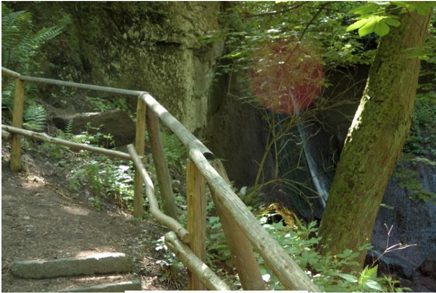
Wasserfall in der Wolfsschlucht