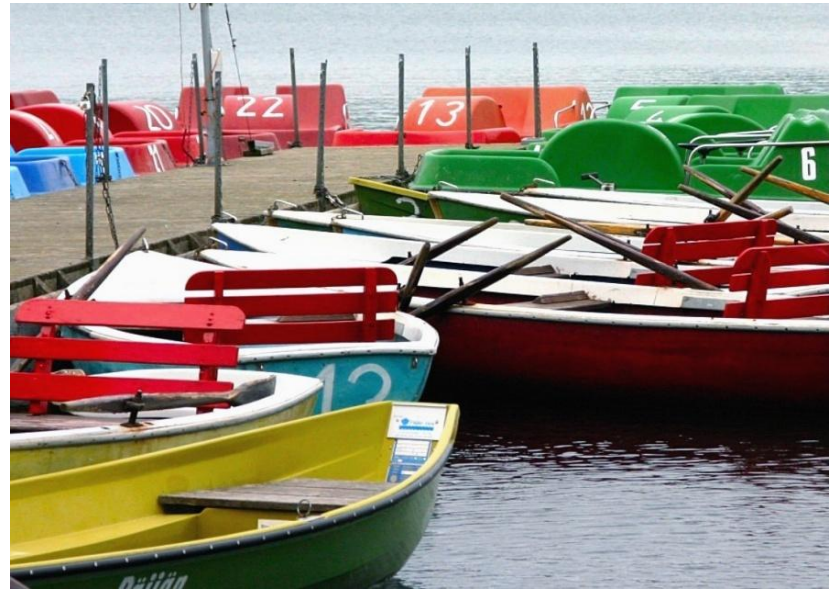
Farbenfroher Bootsverleih am Laacher See