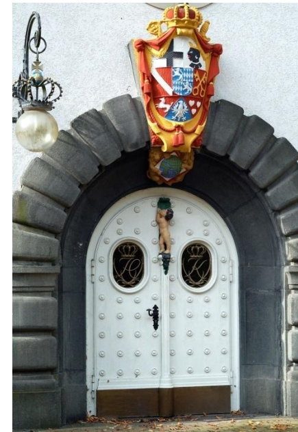
Ehemalige Klinik Tönisstein