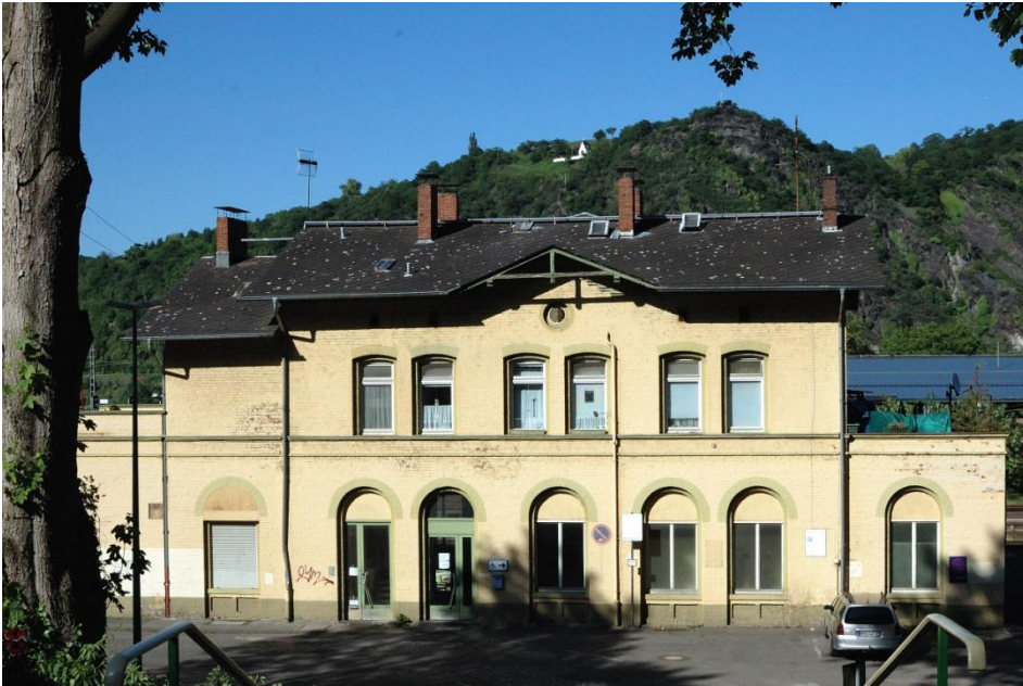
Der Bahnhof von Brohl