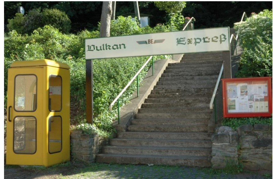
In Brohl beginnt die Privateisenbahn „Vulkan Express“