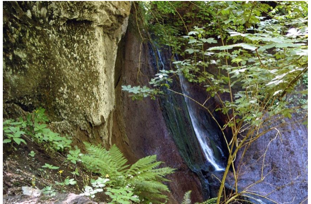
Wasserfall in der Wolfsschlucht