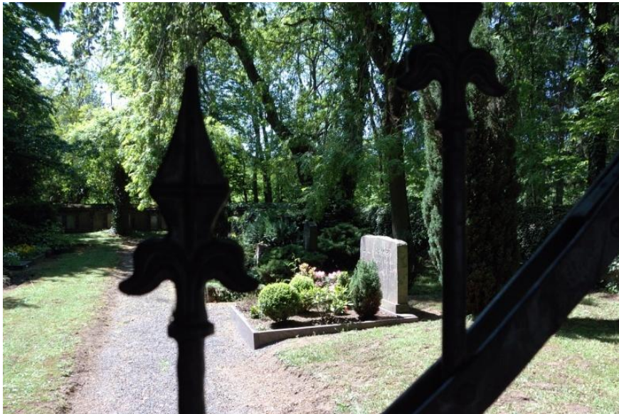
Am Weg liegt ein Menoithenfriedhof