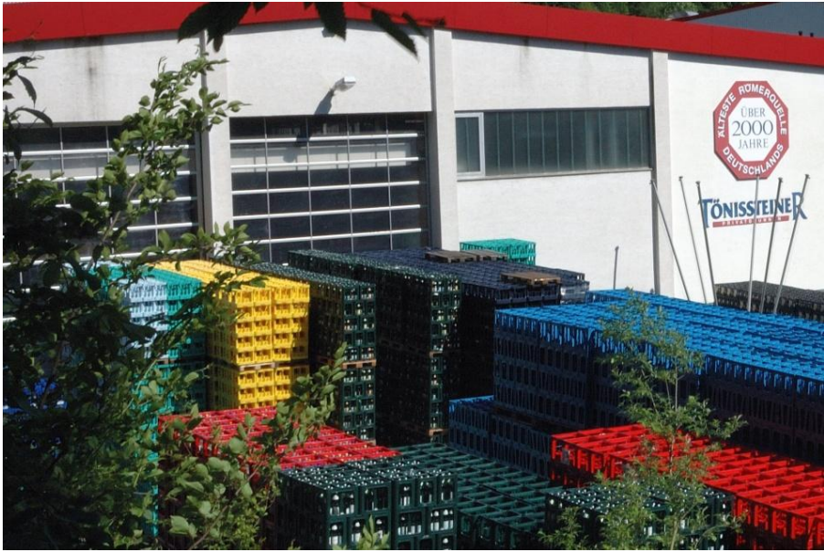
Die bekannte Quell Tönisstein liegt am Weg