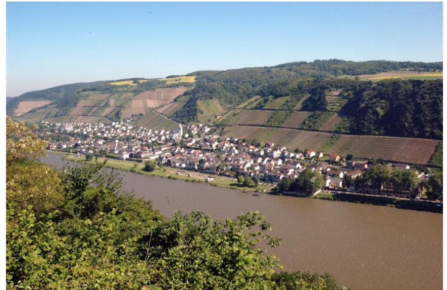
Blick auf Leutesdorf