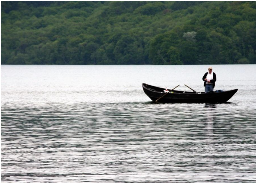
Fischer auf dem Laacher See