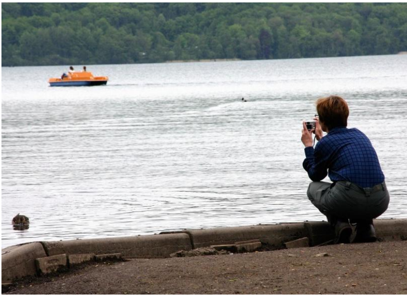
Blick auf den Laacher See