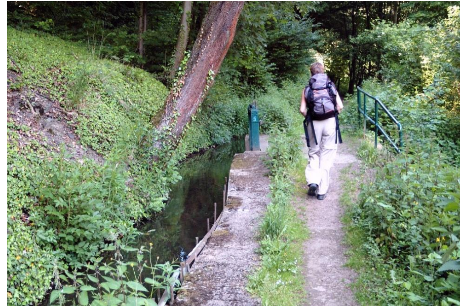
Bald ist Brohl erreicht