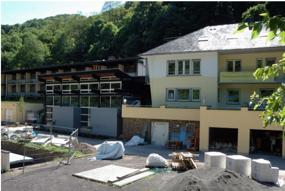
Die ehemalige Klinik Tönisstein wird zur Seniorenresidenz umgebaut