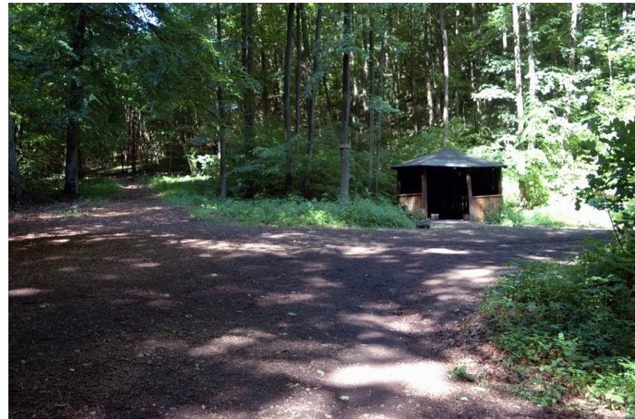
Schutzhütte an einer großen Wegkreuzung