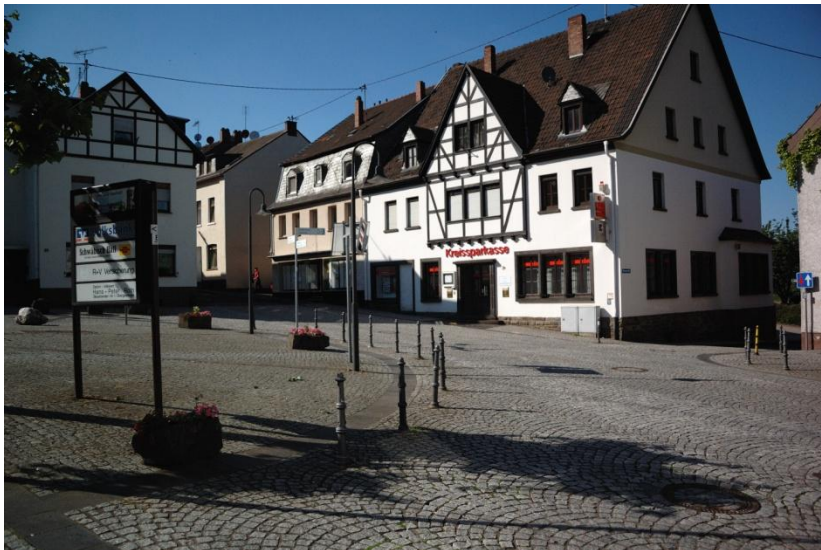
Marktplatz in Brohl