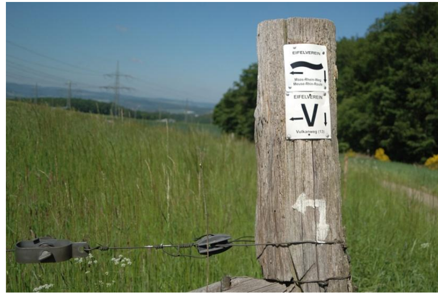
Ein kurzes Stück geht es durch Felder