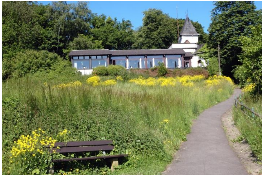
Entlang des Ausflugslokales „Krähennest“