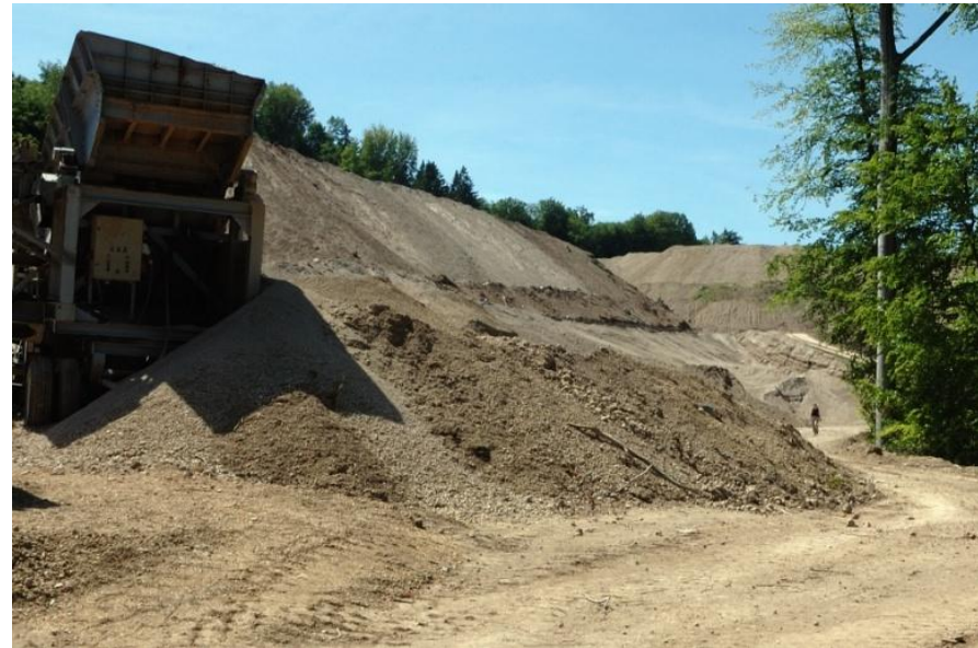
Eine Kiesgrube, die seit 2015 renaturisiert ist.