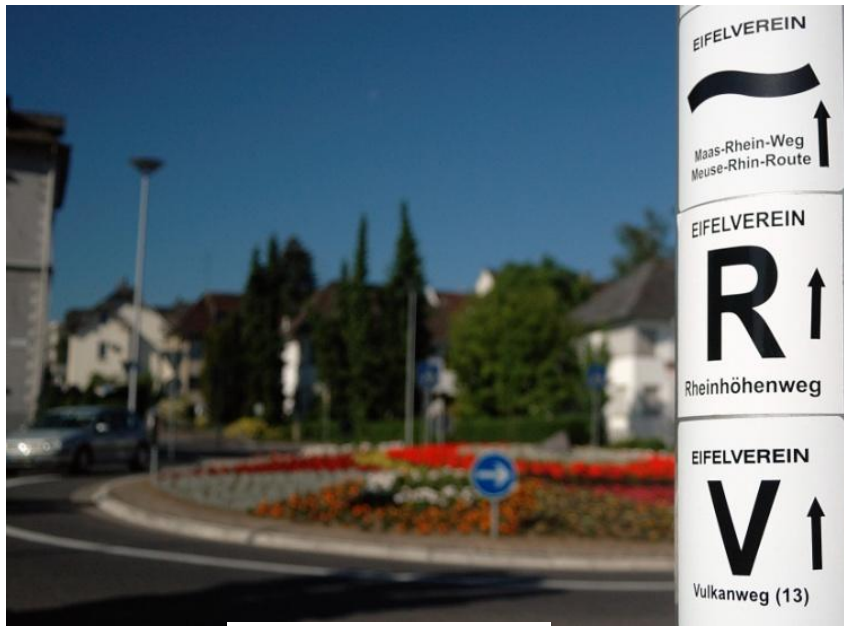
Kreisverkehr in Andernach