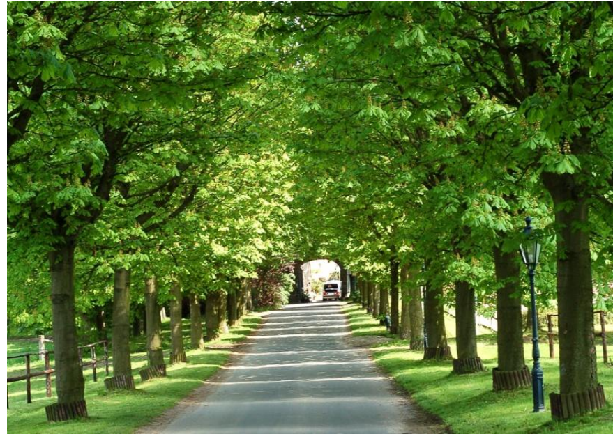
Zufahrt zu Gut Broichhof