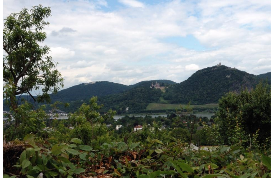
Blick über den Rhein ins Siebengebirge