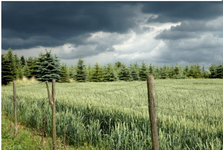
Schlechtwetterfront in Anzug