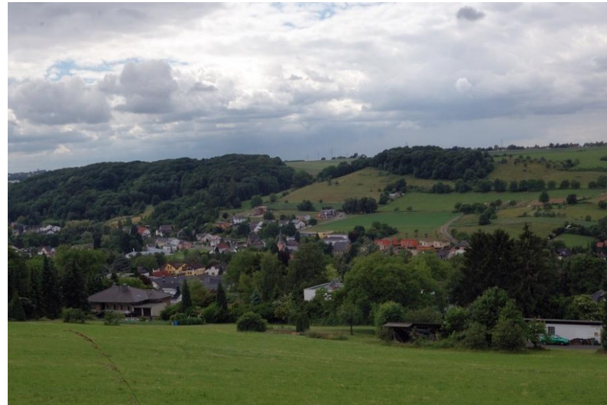
Blick auf Niederbachem