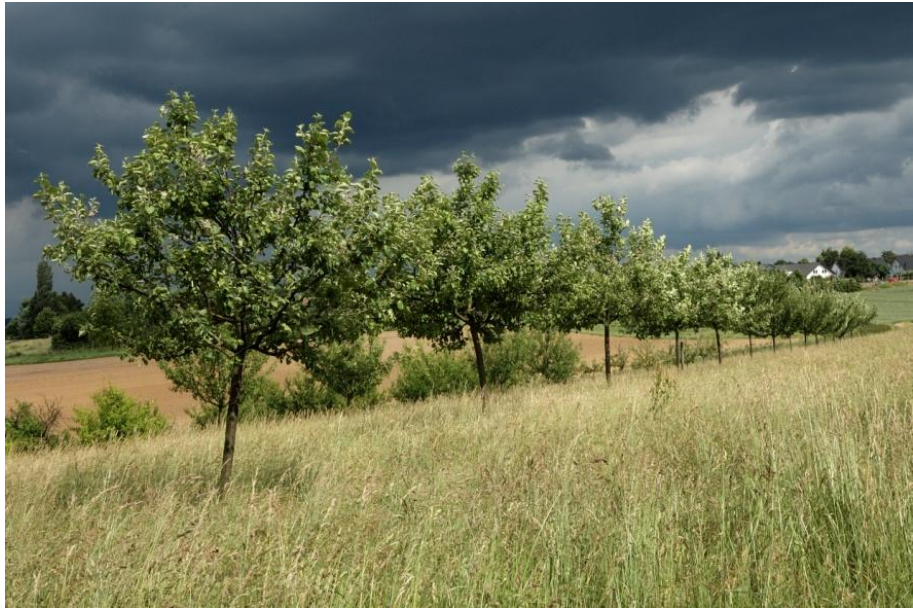
Schlechtwetterfront in Anzug