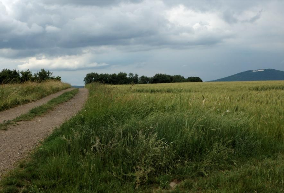
Der Weg führt über schattenlosen Höhen