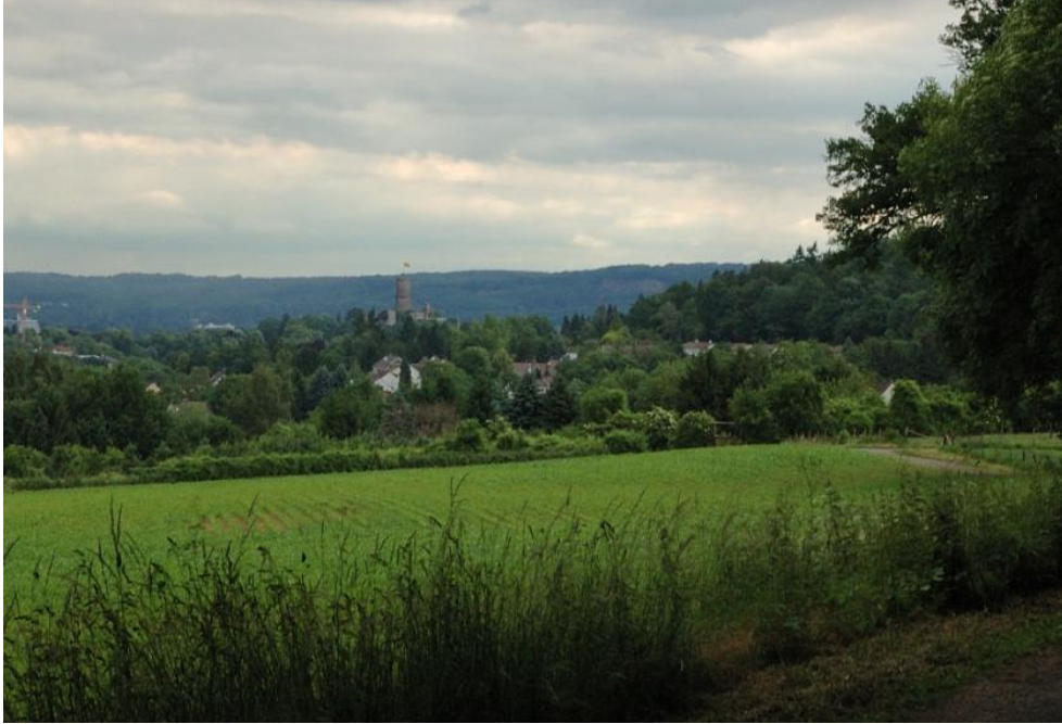
Blick auf die Godesburg