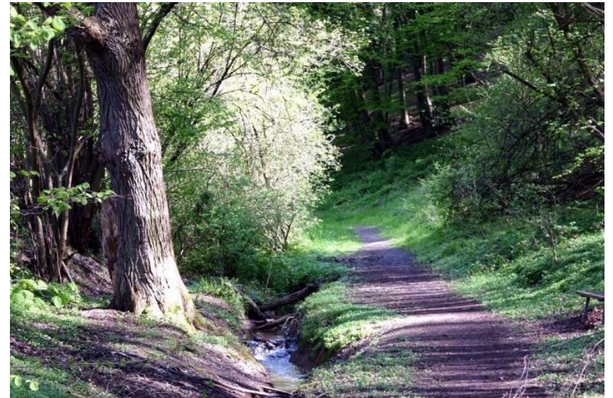
Wanderweg oberhalb von Remagen