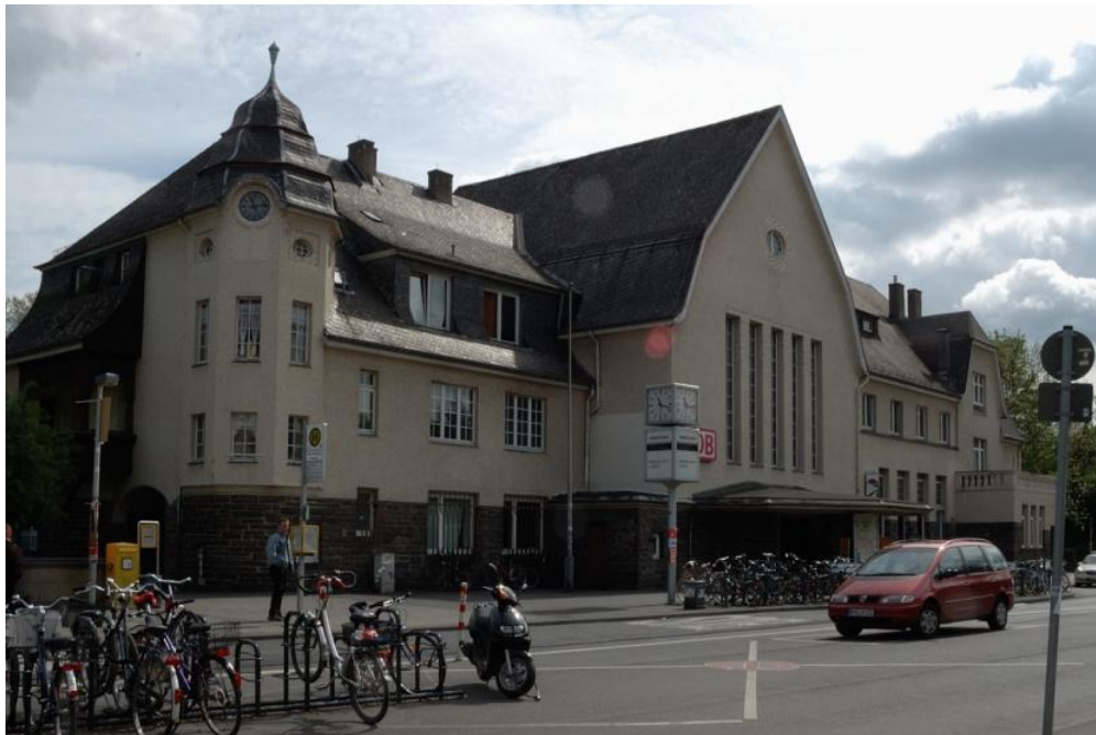
Bahnhof in Bad Godesburg