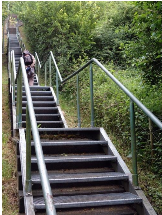
Aufstieg nach Oberwinter