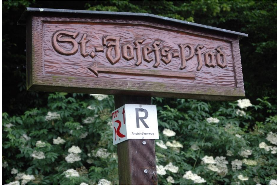
St. Josefs-Pfad durch Bandorf