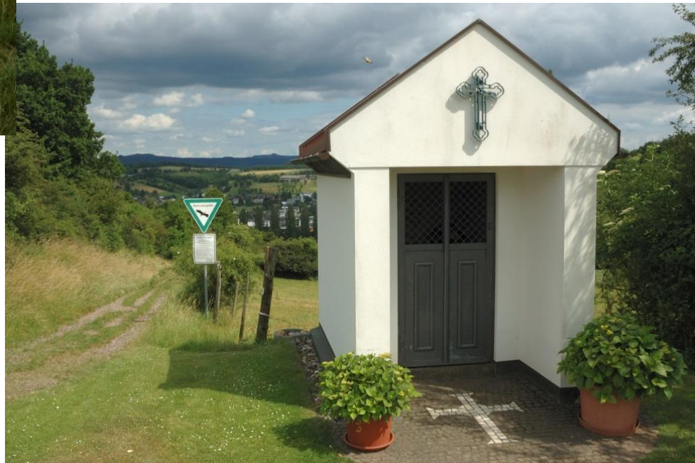
Auf der Höhe über Niederbachem steht eine Kapelle