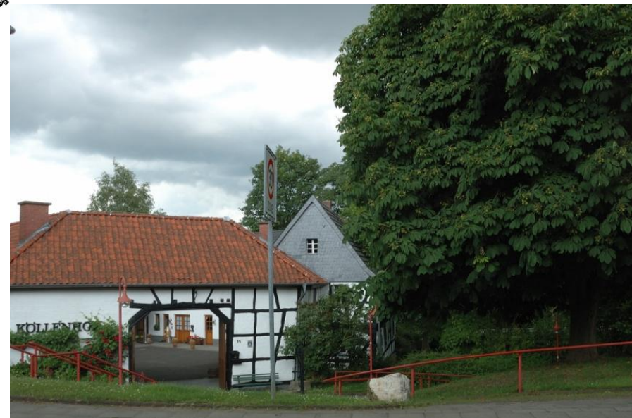
Der Köllenhof in Ließem