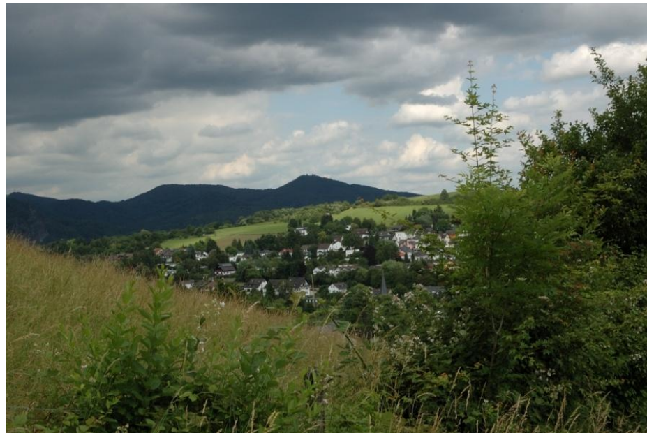
Blick zurück auf das Siebengebirge