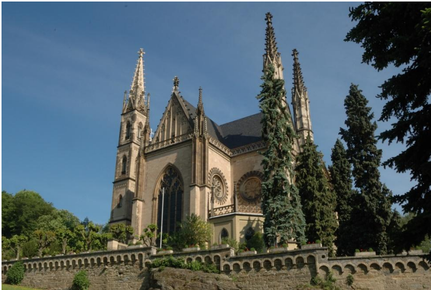
Apollinariskirche in Remagen