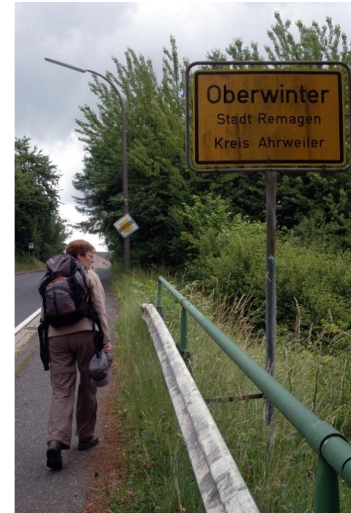
Entlang der Straße