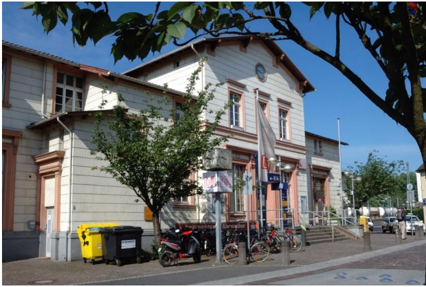
Bahnhof in Remagen Ausgangspunkt der Tour