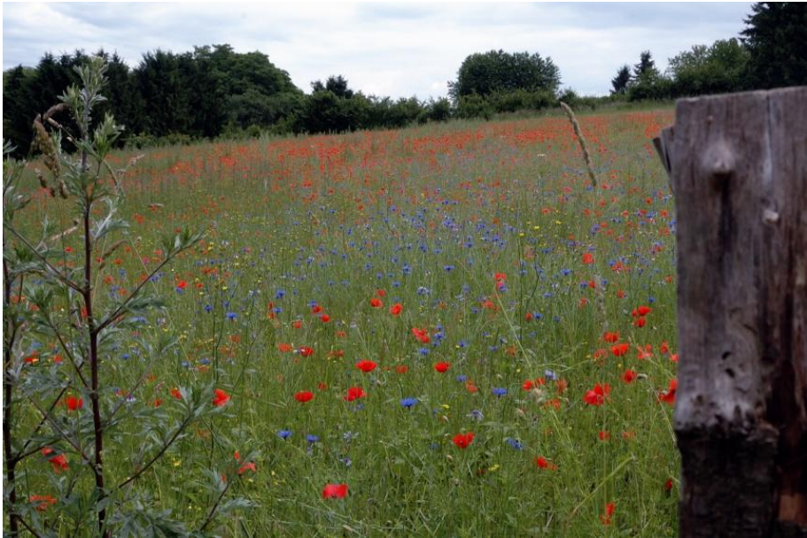
Sommerliche Wiese am Weg