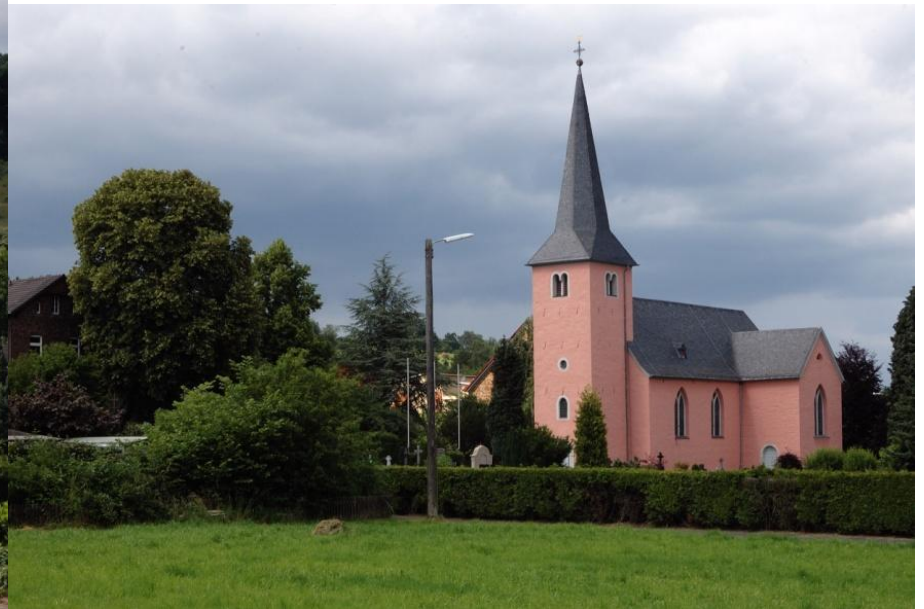
Kirche in Niederbachem