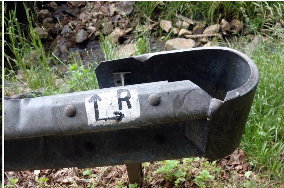
Nicht immer ist die Markierung auf den ersten Blick zu finden