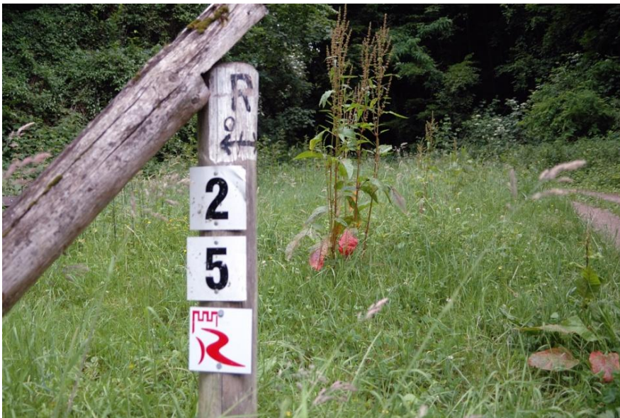
Der Rheinburgenweg und Rheinhöhenweg treffen sich immer wieder