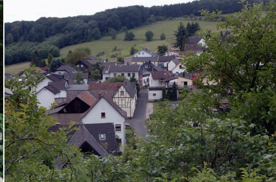
Blick auf Bandorf