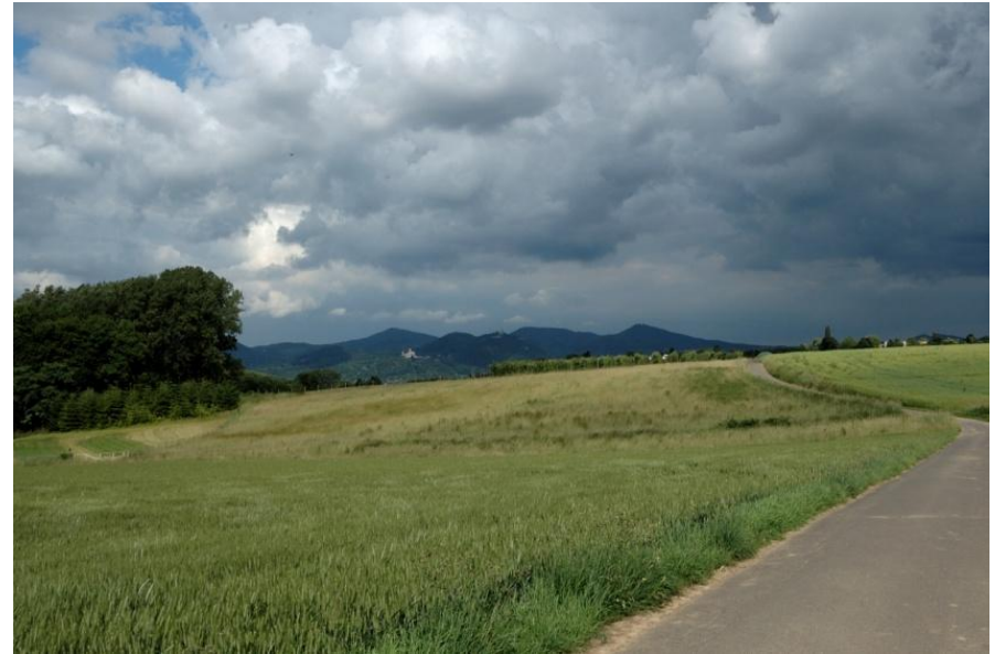
Schlechtwetterfront in Anzug