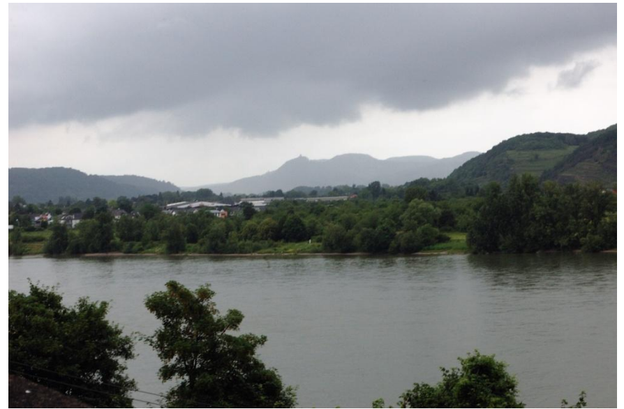
Blick über den Rhein – im Hintergrund der Drachenfels