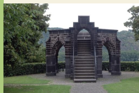
Der Königsstuhl oberhalb von Rhens