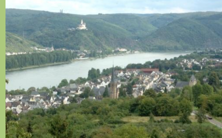
Blick auf Rhens – auf der anderen Rheinseite sieht man die Marksburg