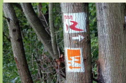
Traumpfad und Rheinburgenweg treffen sich oberhalb von Rhens

Tipp: Abstecher zum restaurierten Schloss Stolzenfels und als Einkehrmöglichkeit die Königsbacher Brauerei