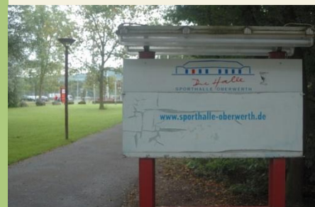
Der Zuweg führt an der Sporthalle Oberwerth vorbei