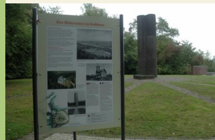
Gedenkstätte Rittersturz – Hier wurde das Grundgesetz beraten