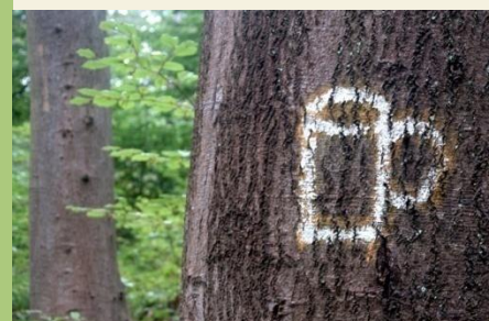
Dieses Zeichen spricht Bände