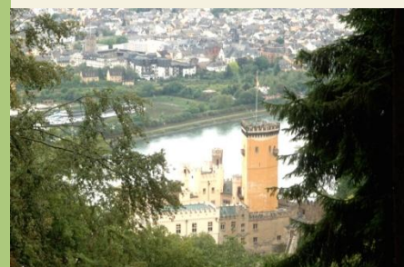
Schloss Stolzenfeld einmal von hinten betrachtet

Rastplätze: Rittersturz, Schutzhütte Dommelsberg, Schutzhütte Weidgenhütte, Schutzhütte Rotweiß, Traumpfadbank, Antoniuskapelle, Königsstuhl