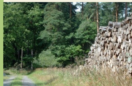
Überwiegend führt die heutige Etappe durch Wald