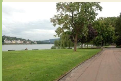
Zunächst auf der Rheinpromenade

Verkehrsverbindungen: Rhens Bhf– Koblenz Hbf Bahn