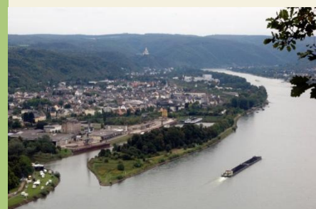
Blick auf den Rhein bei Lahnstein – links die Mündung der Lahn