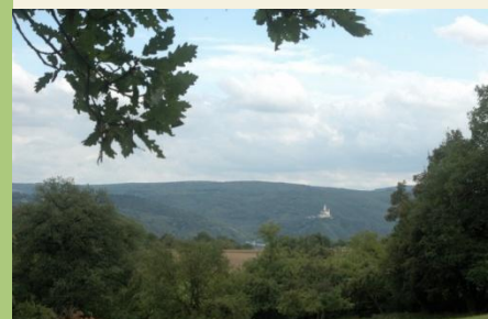
Im Hintergrund die Marksburg