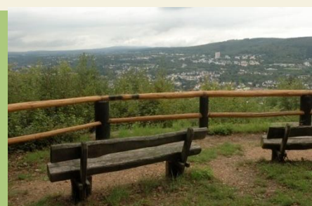
Blick auf die Horchheimer Höhen