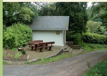
An der St. Antonius Kapelle ist auch eine schöne Raststelle