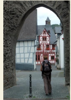
Durch ein Tor geht es nach Rhens hinein