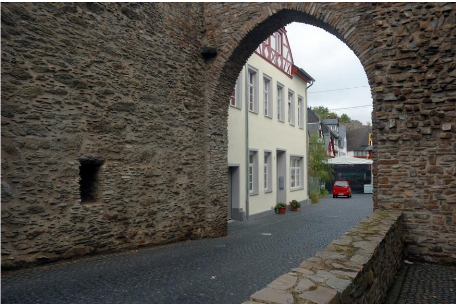
Die alte Stadtmauer in Rhens