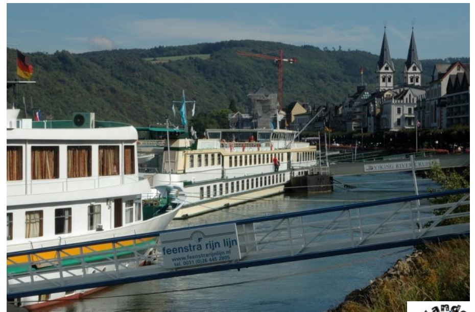
Auf der Rheinpromenade