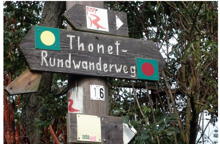
Der Möbeldesigner Thonet stammt aus Boppard