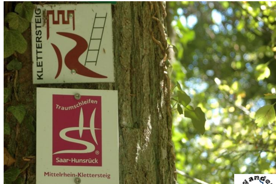
Ein Seltenheit: Ein Rheinburgenweg mit Leiterzeichen für einen alpinen Wegabschnitt