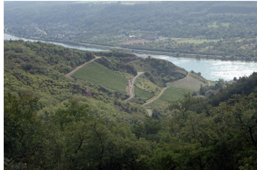
Blick auf ein Seitental am Bopparder Hamm