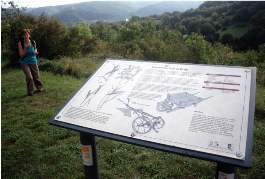
Oberhalb von Bray gibt es Hinweise zu Land und Leute