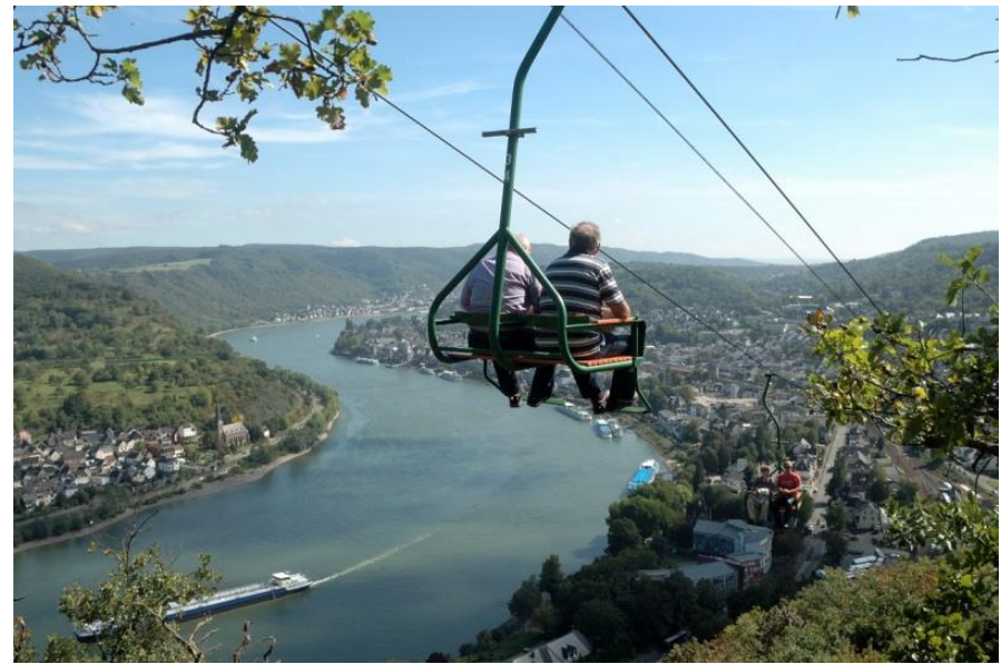
Der Sessellift führt von Boppard auf die Rheinhöhen