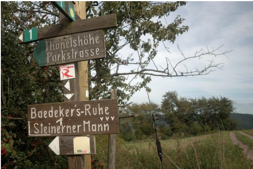
Über die Rheinhöhen geht es Richtung Bad Salzig