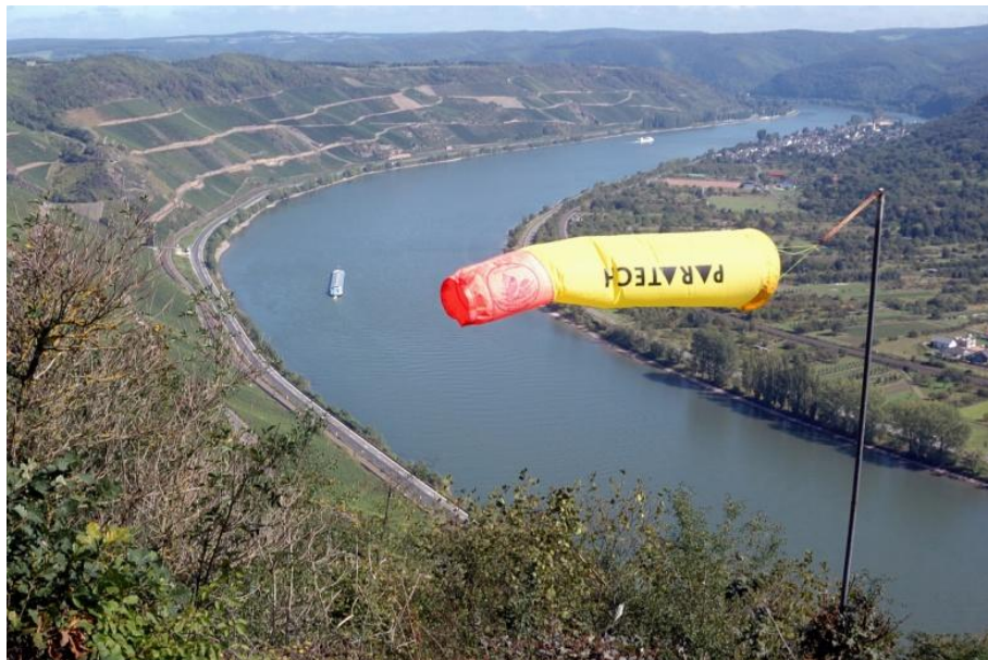
Hier starten Gleitschirmflieger