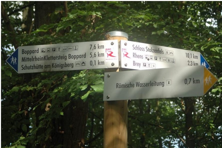
Hinweis auf eine römische Wasserleitung