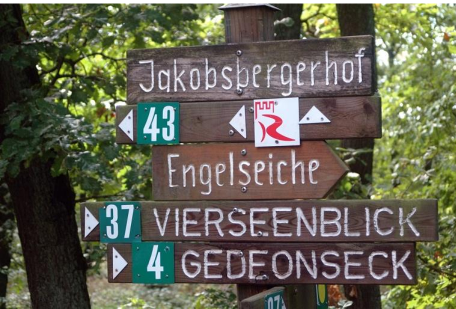
Auf gut markierten Wege geht es Richtung Vierseenblick