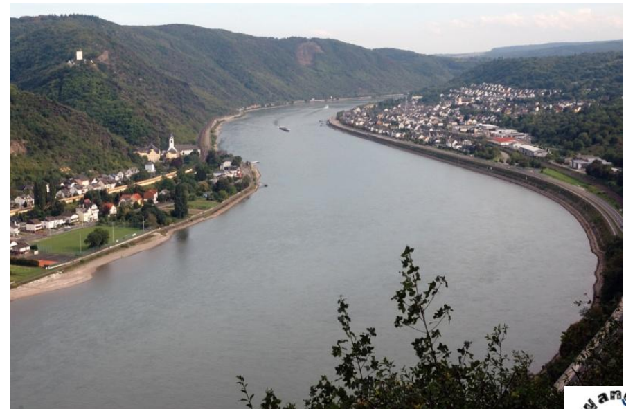
Blick auf das heutige Ziel: Bad Salzig