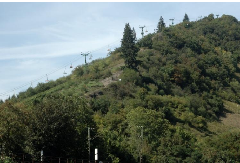
Unterhalbdes Sesselliftes führ der Rheinburgenweg entlang