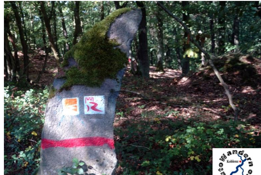
Durch den Hünengräberwald geht auch ein Traumpfad