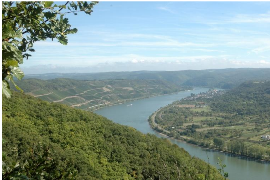
Blick auf den Rhein und den Bopparder Hamm