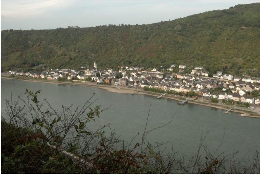
Blick zurück auf Kamp-Bornhofen