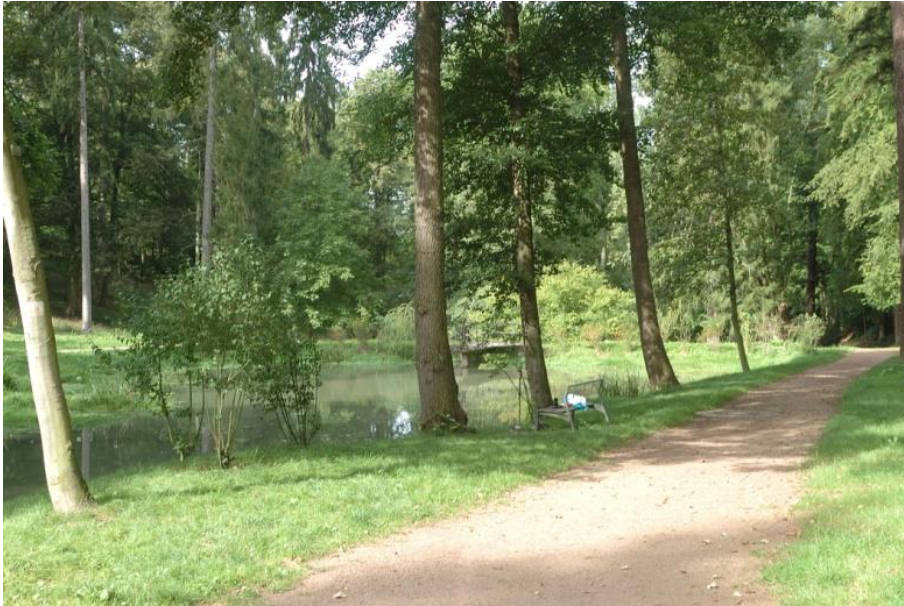
Durch den Stadtpark in Boppard