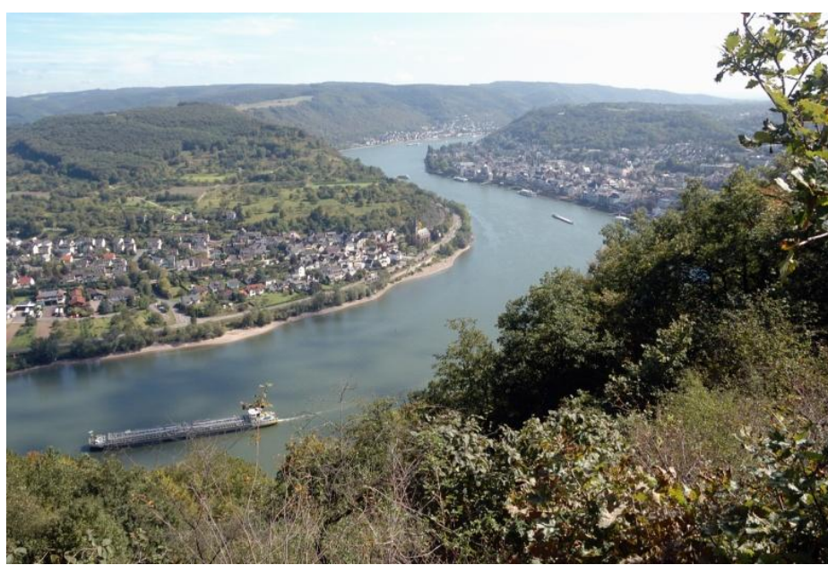
Blick auf den Rhein bei Boppard