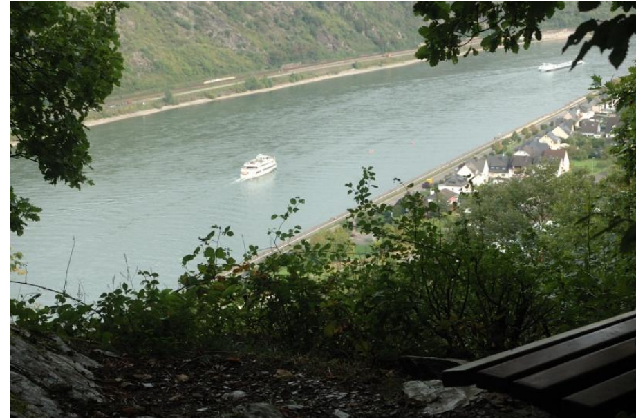
Aussichtspunkt oberhalb von Bad Salzig