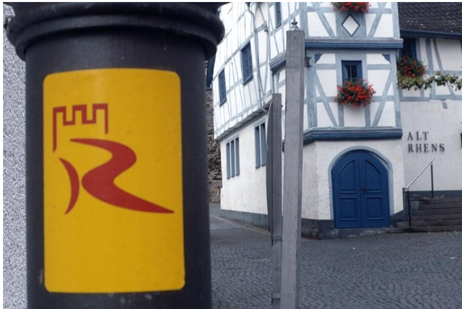
Zunächst folgen wir der rot-gelben Verbindungswegmarkierung