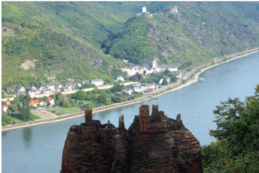
Blick auf die „Feindlichen Brüder“ Burg Sterrenberg und Burg Liebenstein