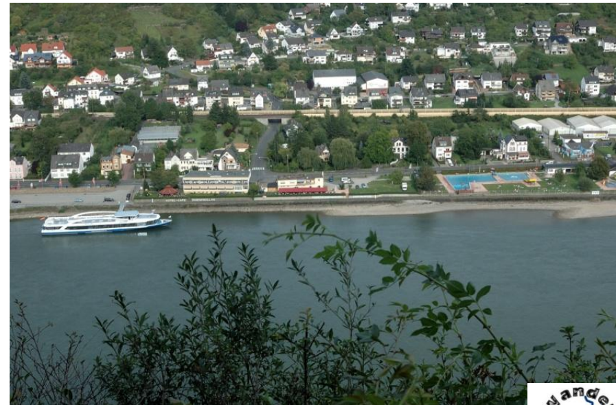
Blick auf Kamp-Bornhofen