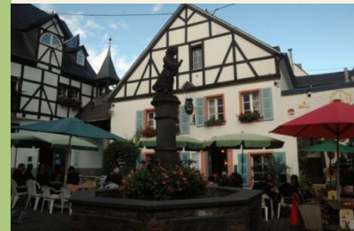
Hexenbrunnen in Winningen