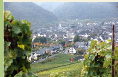
Blick auf Winnigen

Hier haben wir die Möglichkeit nach links zu gehen und so nach Kobern-Gondorf zu gelangen oder aber nach rechts zu gehen. Wir wählen die Variante nach rechts und wandern den Mosel-Radwanderweg nach Winnigen. Den Weg geht es geradeaus bis das wir an der Brücke, die über die Eisenbahn führt, vorbei kommen. Kurz hinter der Brücke geht es rechts ab. Dem Linksknick des Weges folgend, gehen wir nun parallel zur Eisenbahnlinie über die Zehnthofstraße nach Winnigen hinein. An der Kirche biegen wir rechts ab und stoßen auf die Straße, die parallel zur Mosel verläuft und uns in wenigen Minuten zum Bahnhof bringt.