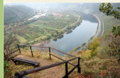
An diesem Aussichtspunkt macht der Moselhöhenweg seinem Namen alle Ehre