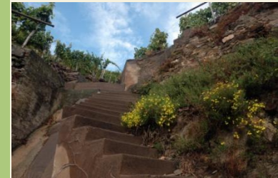
Impressionen im Weinberg

Verkehrsverbindungen: Koblenz Hbf – Güls Bhf Bahn Winningen Bhf – Koblenz Hbf Bahn