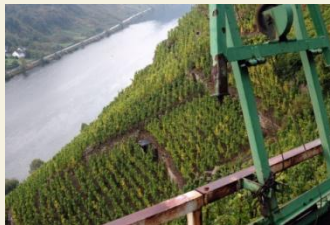
Blick über Steillagen bei Winningen