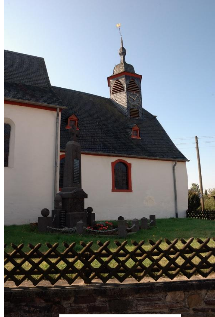
Dorfkirche in Lassarg