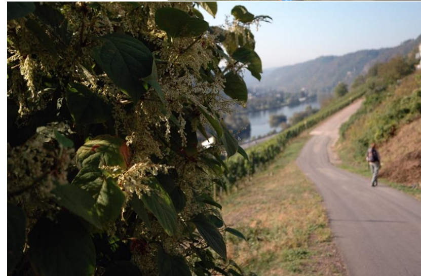
Zunächst führt ein breiter Weg durch das Moseltal