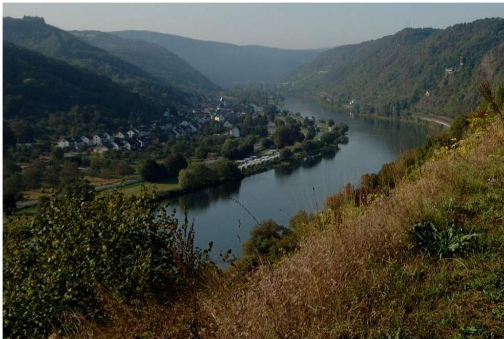
Blick auf Mosel und Burgen Rechts im Hintergrund Burg Bischofsstein