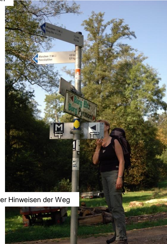
Wo ist vor lauter Hinweisen der Weg