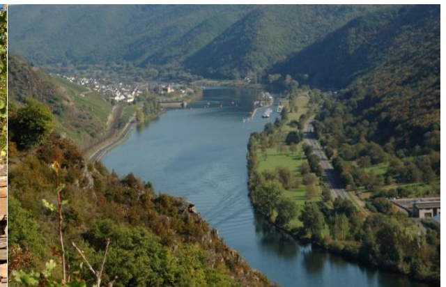
Blick zurück auf Münden