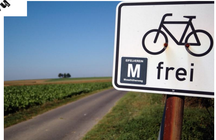
Der Anstieg ist geschafft. Auf den Moselhöhen ist auch gut radeln