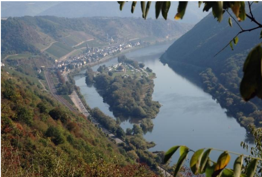
Blick zurück auf Hatzenport