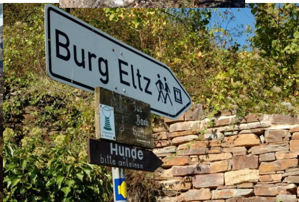
Von Treis-Karden beginnt Einstieg zur Burg Elz hier