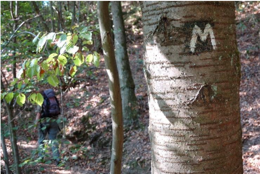
Wir folgen der Markierung: weißes M