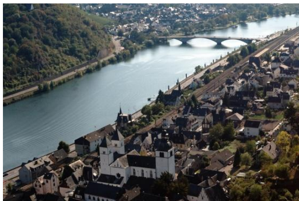
Blick auf Treis-Karden