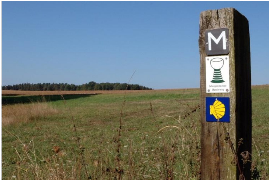
Parallel zum Moselhöhenweg führen weitere Wege über die Moselhöhen