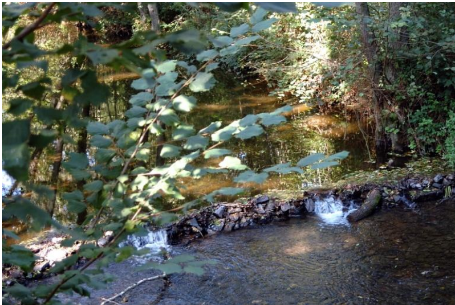
Nach Burg Elz überqueren wir die Elz