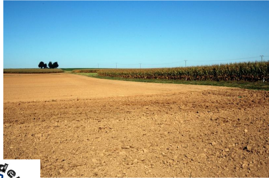
Abgeerntete Felder im Herbst