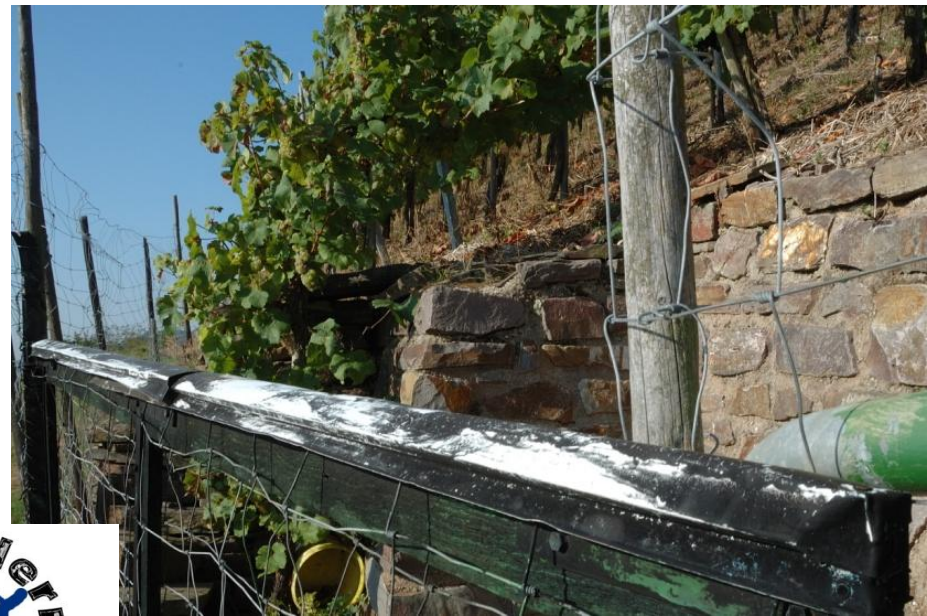
An Weinbergen vorbei geht es immer weiter aufwärts