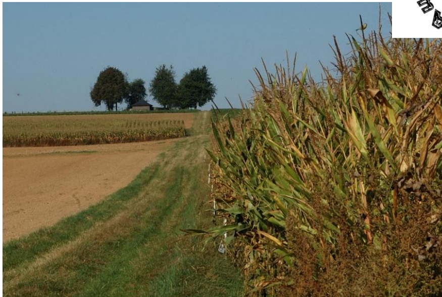
Die Moselhöhen werden stark landwirtschaftlich genutzt