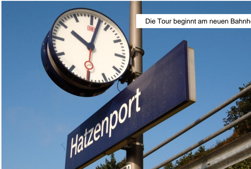
Die Tour beginnt am neuen Bahnhof in Hatzenport