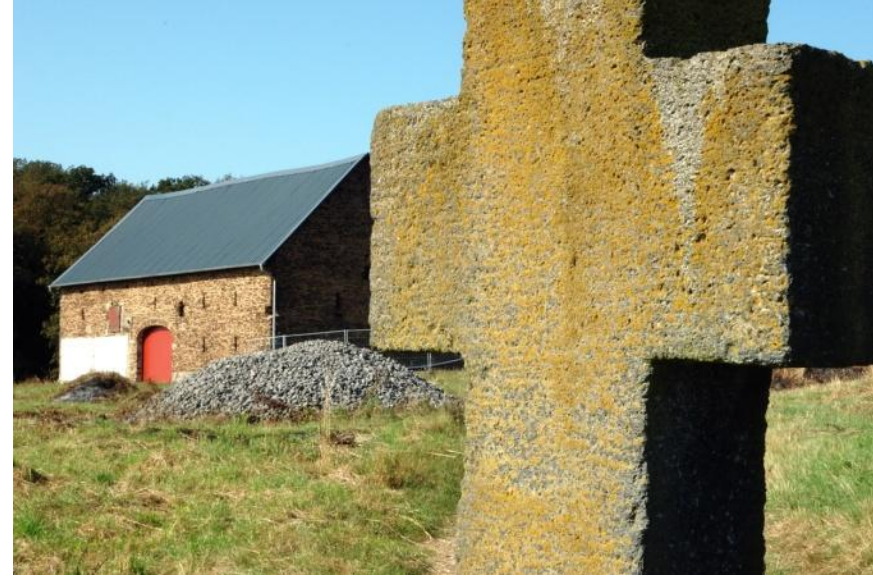
Vorbei an einsamen Gehöften