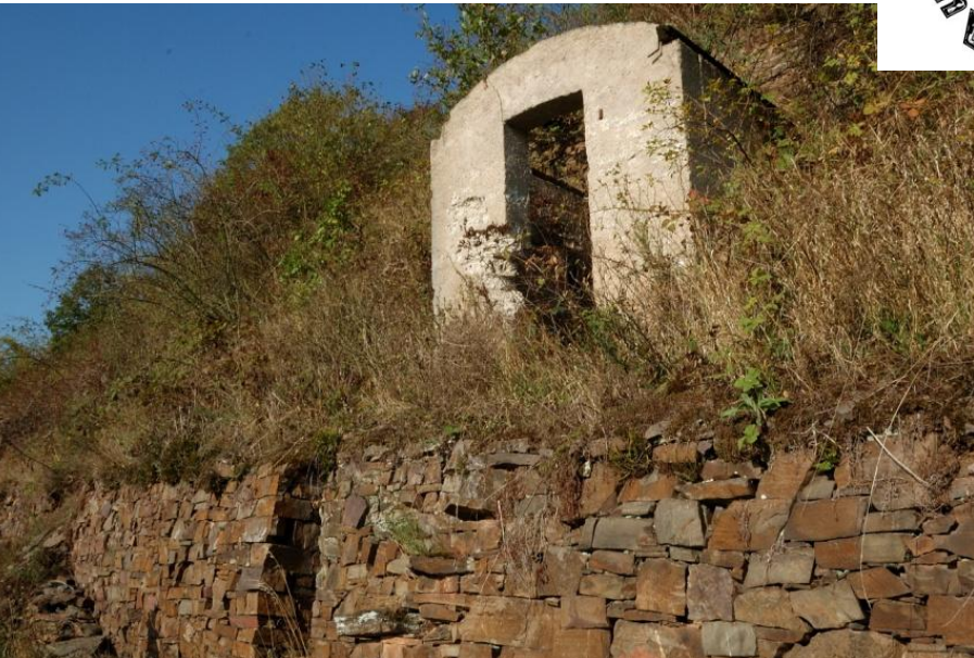
Impressionen in trockengelegten Weinbergen