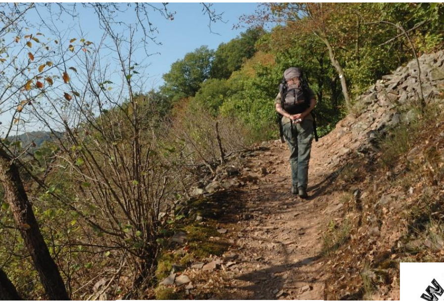
Doch schon bald wird der Weg zu einem schmalen Pfad