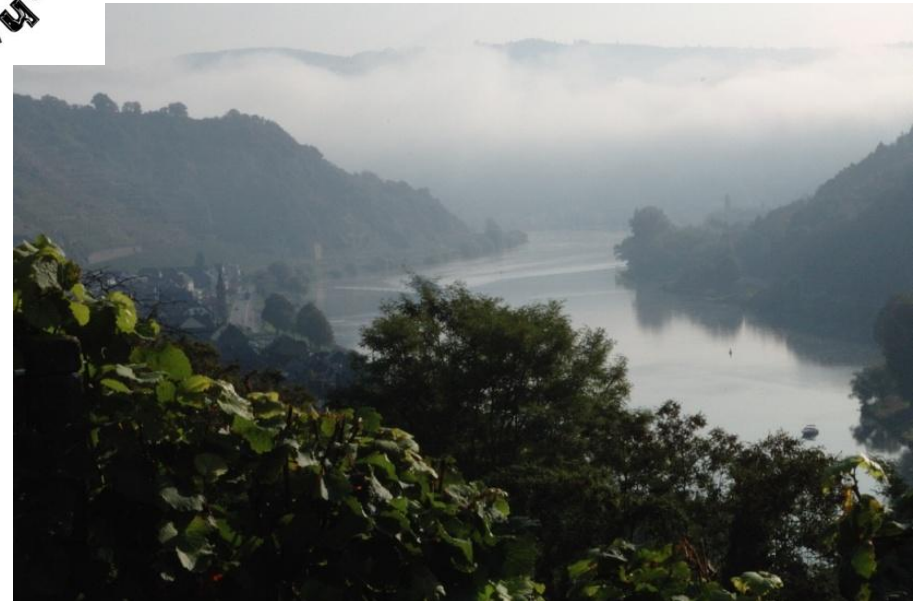
Morgendlicher Nebel über der Mosel bei Hatzenport