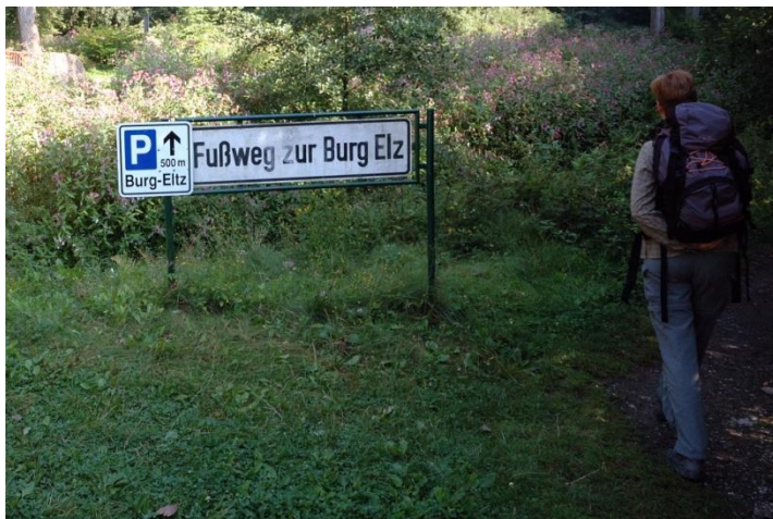
... geht es auf zunächst gut markierten Fußweg ...