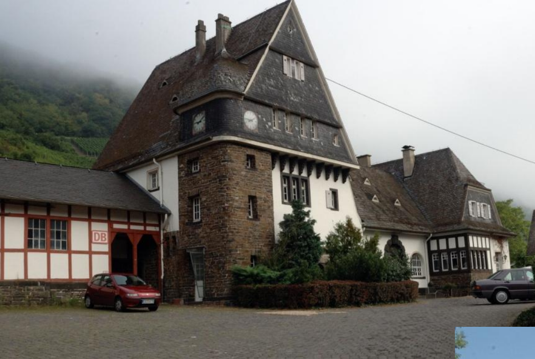
Ausgangspunkt der Wanderung ist der Bahnhof in Moselkern