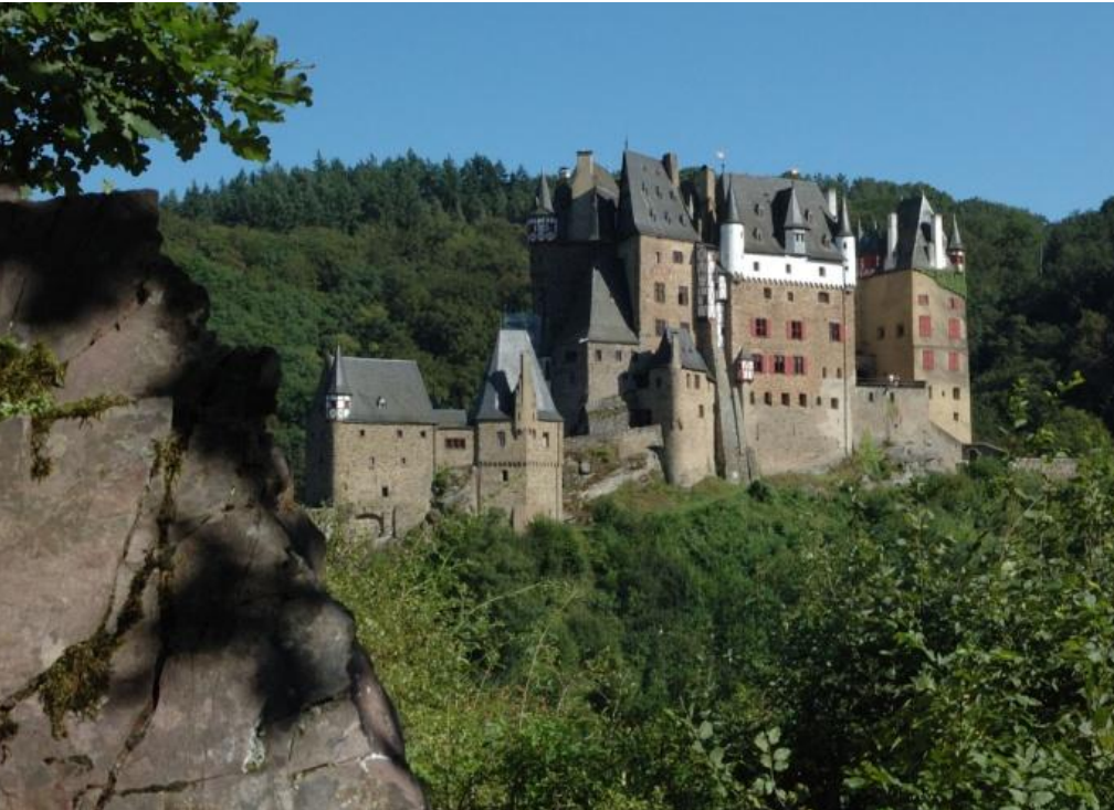
Von den alten Fünfhundertmarkschein hinlänglich bekannt: Burg Eltz