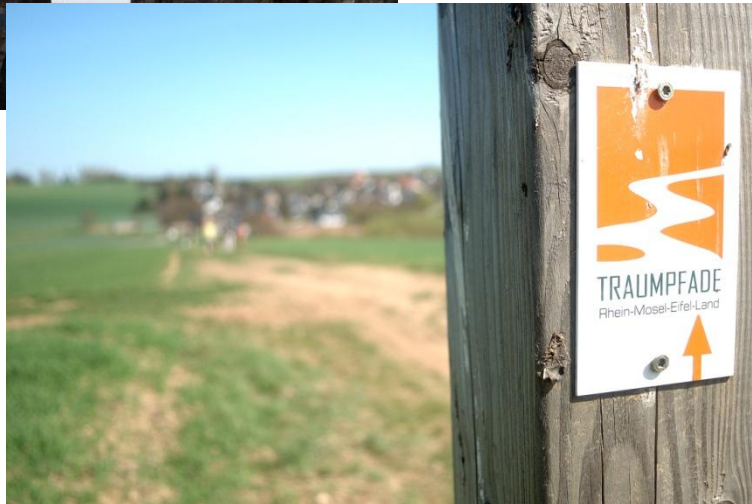
Auf Wiesenflächen ermöglichen Markierungsposten die Orientierung