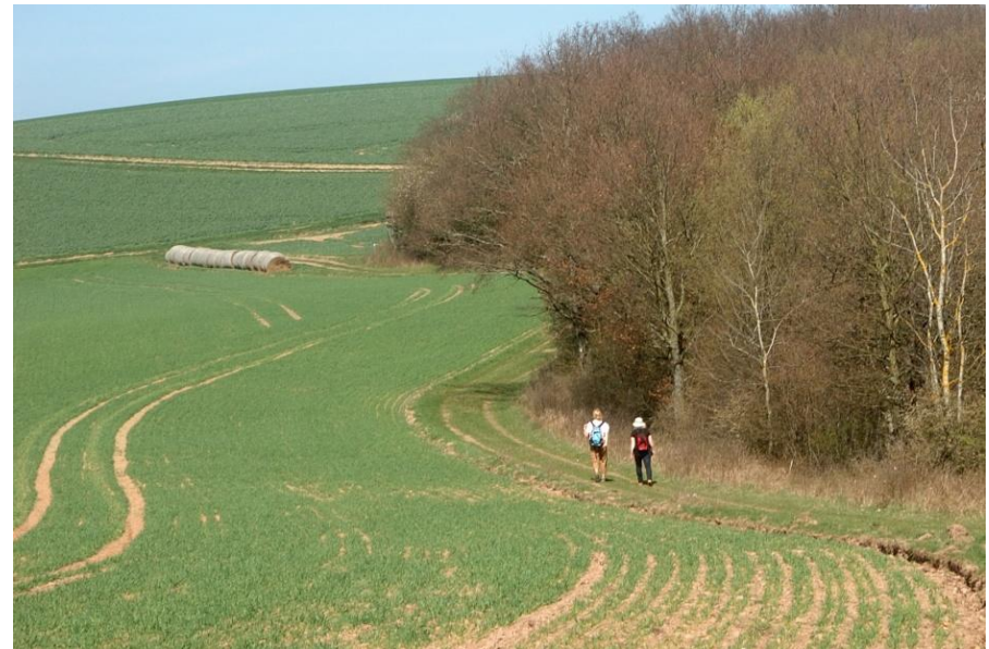
Der Weg ist im Mittelteil vielfach unbeschattet