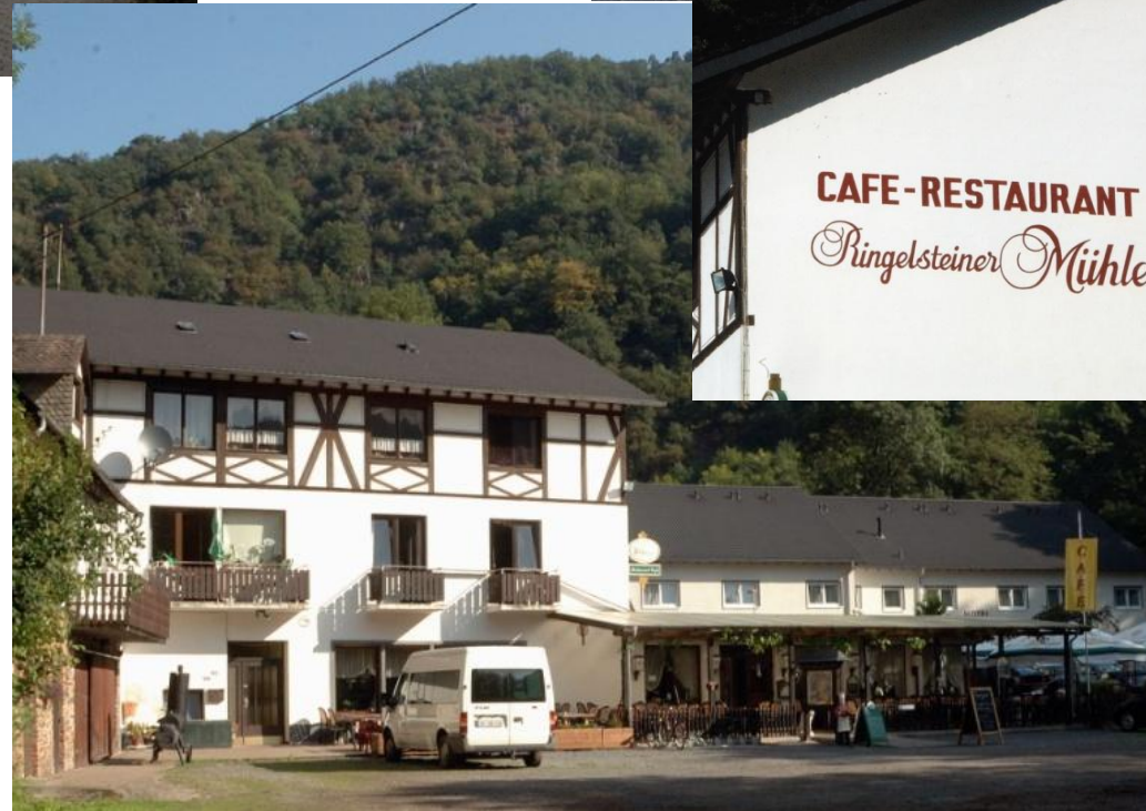
... zur Ringelsteiner Mühle.