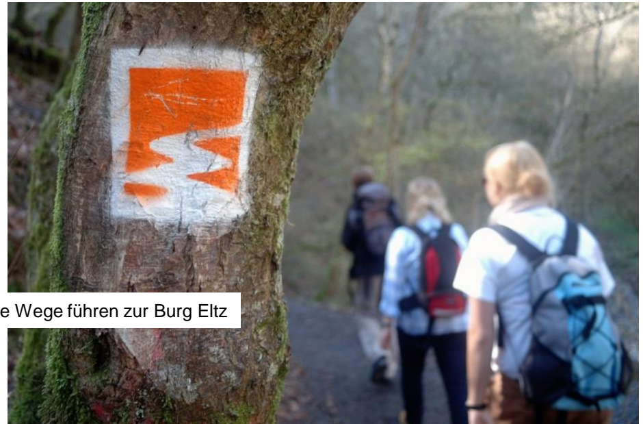
Viele Wege führen zur Burg Eltz