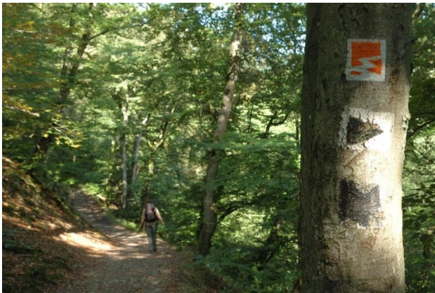
An der Ringelsteiner Mühle beginnt auch der orange markierter Traumpfad