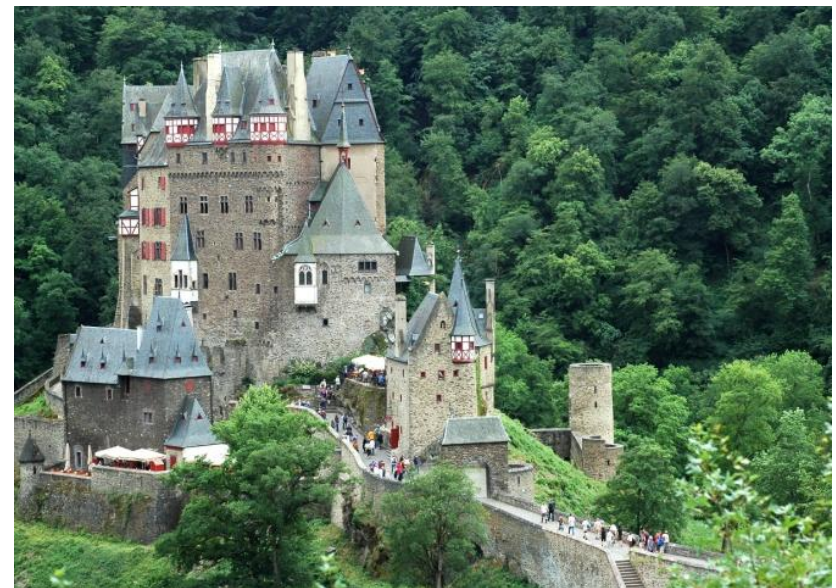
Burg Elz zieht zu recht viele Besucher an