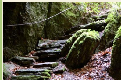
Abstieg zum Donnerloch