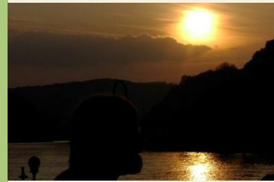
Abendstimmung in Brodenbach