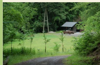
Rastplatz in der Nähe der Eckmühle