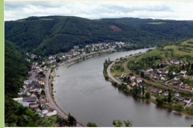
Mosel zwischen Brodenbach und Löff

Wir kommen zu einem weiteren Wegweiser, der uns zur Ehrenburg und nach Brodenbach führt. 5 Minuten später ist auf der linken Seite die Grünemühle, die leider kein Gasthaus ist, zu sehen. Dort geht der Weg in eine Kehre und führt uns steil ansteigend Richtung Ehrenburg. An der nächsten Weggabelung können wir getrost weiter geradeaus gehen, auch wenn sich hier M und Traumpfad trennen. Nach ca 500 m treffen sich die beiden Wege wieder.