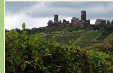
Burg Thurant bei Alken

Verkehrsverbindungen: Koblenz Hbf – Löf Bhf Bahn Brodenbach – Koblenz Hbf Bus