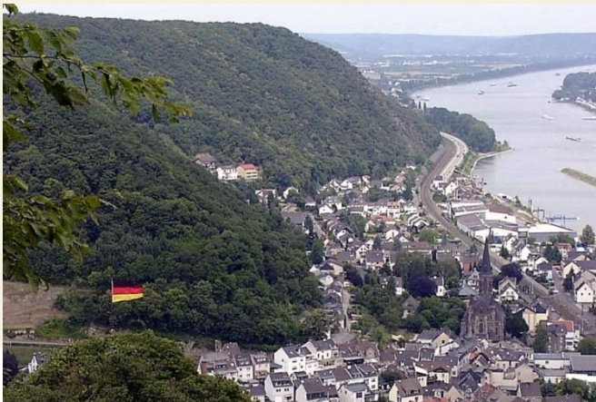
Blick ins Rheintal

Die erste Hälfte des Rheinhöhenweges kann überzeugen. Typischerweise entfernt sich der Rheinhöhenweg relativ weit vom Rhein (anders als der Rheinsteig). Die überwiegenden Wege sind gut zu gehen. Nach Brohl geht es aber steil bergab. Die Markierung im Ort Brohl war zur Zeit unserer Wanderung nur schlecht zu finden. Interessant auf der Wanderung war ein römischer Basaltsteinbruch, den wir durchquerten. Im Steinbruch waren Schautafeln mit Erläuterungen angebracht, so dass die eine oder andere Viertelstunde „verloren“ ging.