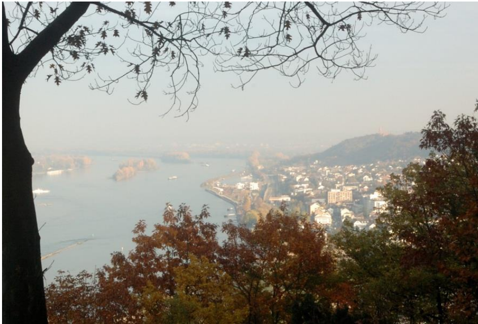
Blick auf Bingen