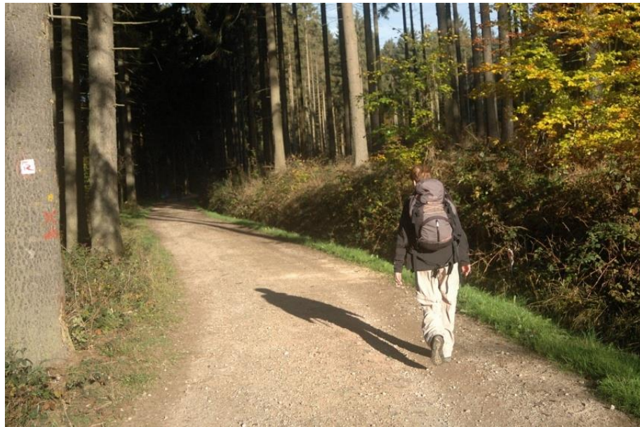
Nach der Steckeschlääferklamm geht es in den Binger Stadtwald