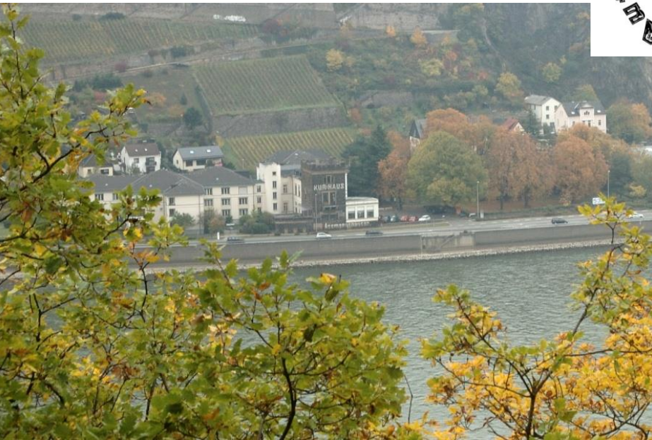
Blick auf den Rhein bei Assmannshausen