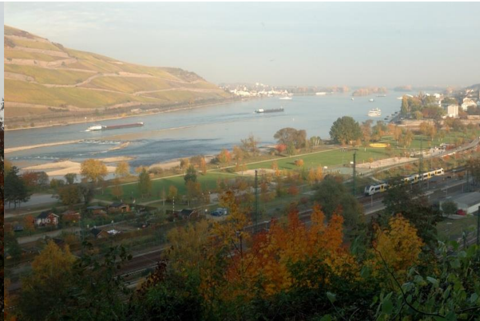
Rheinblick bei Bingen