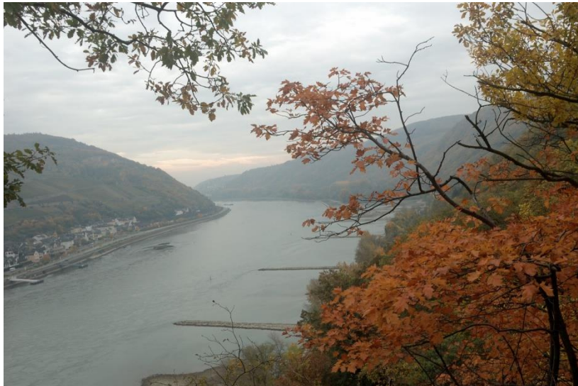
Blick auf des Binger Loch im Herbst