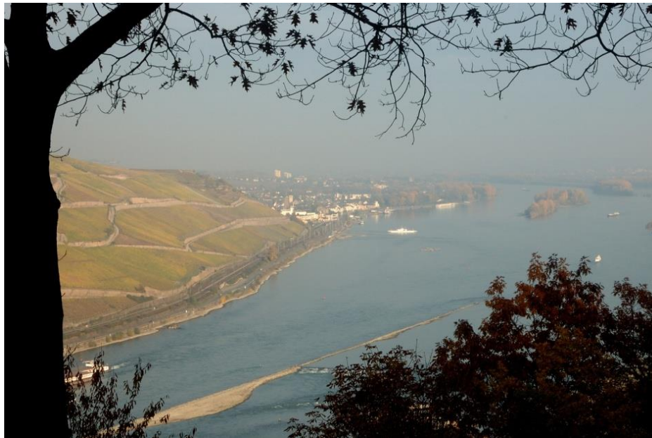
Blick auf Rudesheim