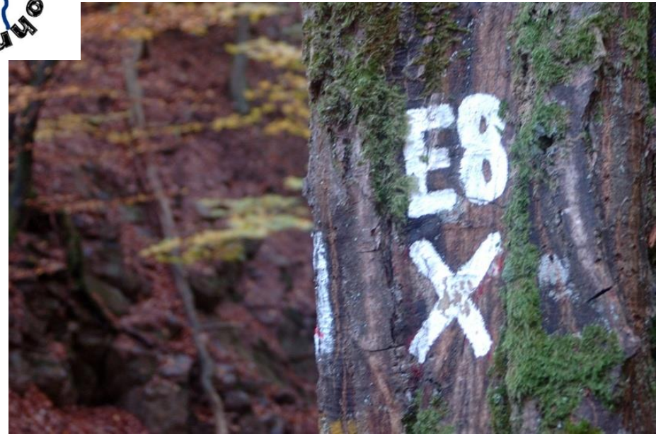
Auch der Europäische Fernwanderweg führt durch die Steckeschlääferklamm