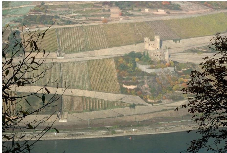
Blick auf Burg Ehrenfels