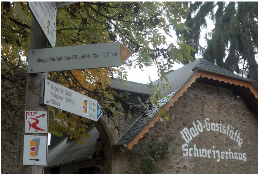
Bald ist die Wald- Gaststätte Schweizerhaus erreicht