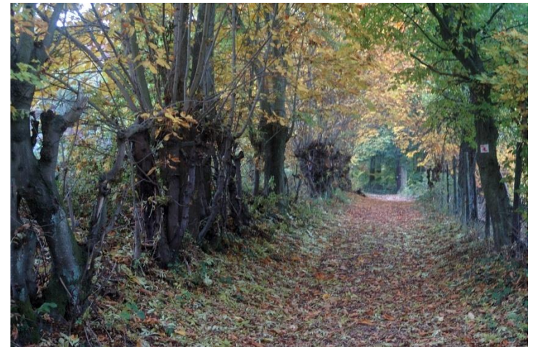
Nach dem Schweizerhaus führt der Rheinburgenweg in einem weiten Bogen durch den Binger Stadtwald