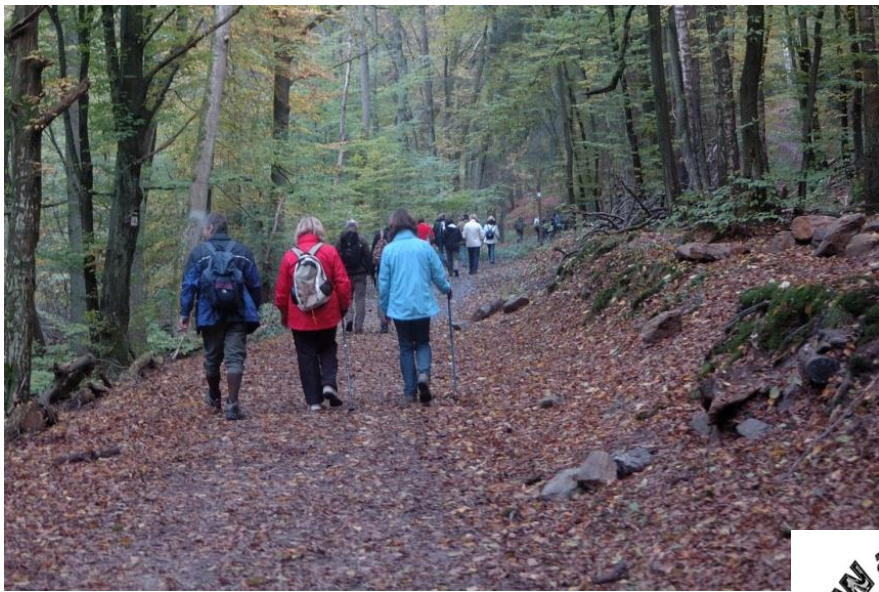
Durch das Morgental führt ein bekannter Weg