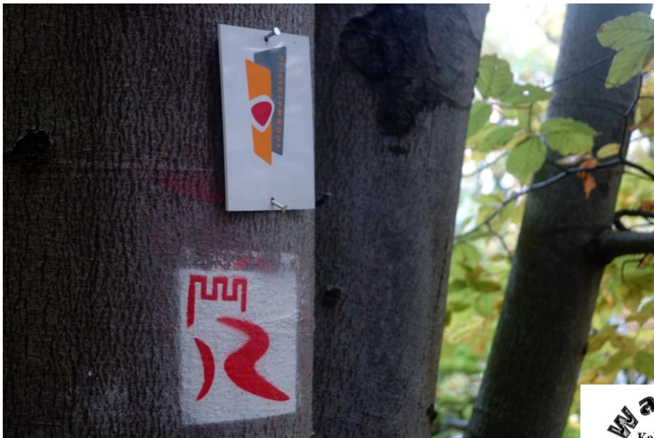
Schon bald trifft der Rheinburgenweg auf den Soonwaldsteig