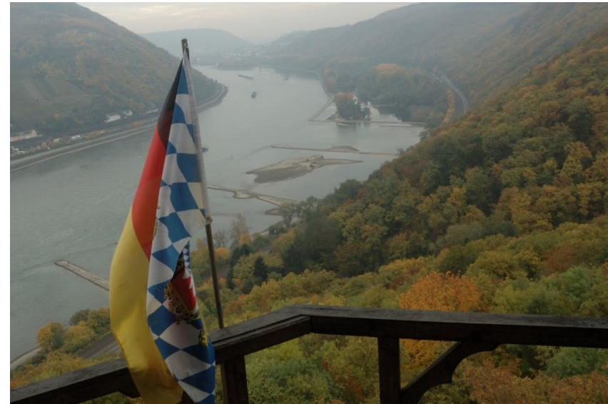
Blick vom Balkon des Schweizerhauses