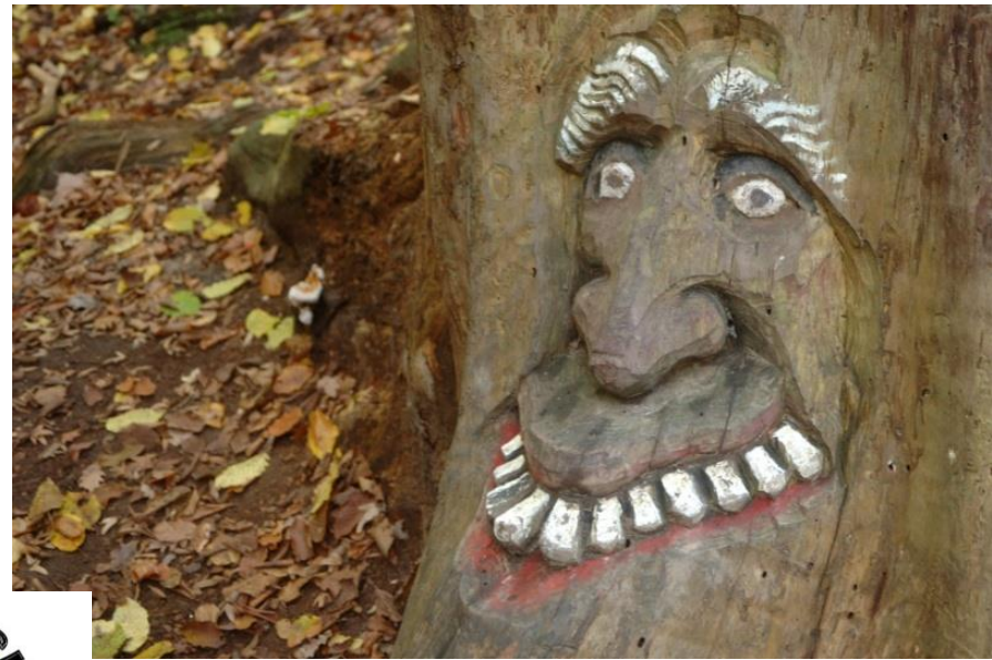
Am Eingang der Steckeschlääferklamm begrüßt uns ein Wurzelmann