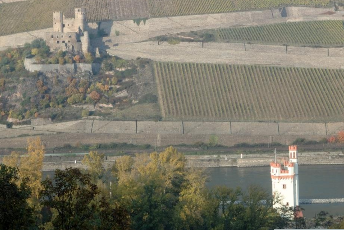
Blick auf Burg Ehrenfels und den Binger Mäuseturm