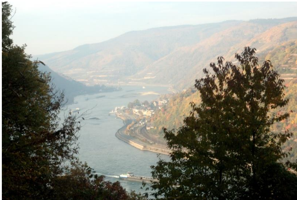
Rheinschleife bei Assmannshausen