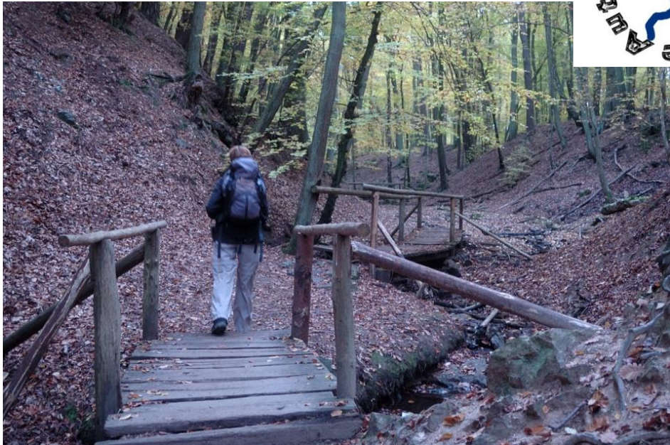
Die Steckeschlääferklamm ist über Holzstege erschlossen